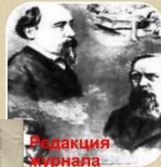
Редакция журнала современник

Литературный и политический журнал «Современник»