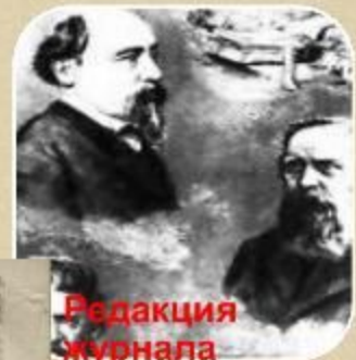
Редакция журнала современник

Литературный и политический журнал «Современник»