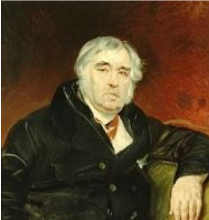
Иван Андрее вич Крылов (1769 - 1844)