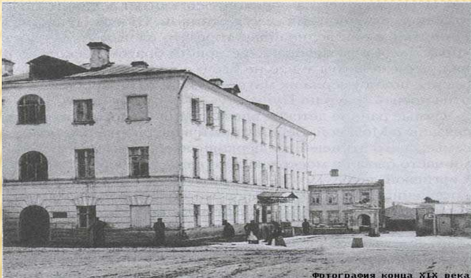
Фотография конца XIX века.