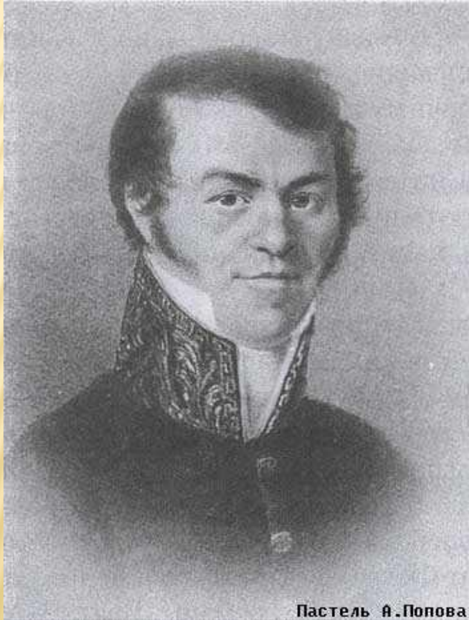
Пастель А. Попова