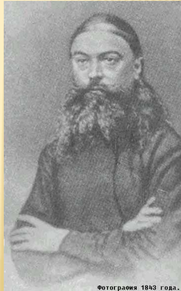
Фотография 1843 года.