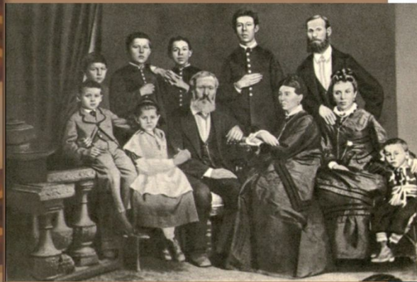
Семья Чеховых в Таганроге

Антон Павлович Чехов родился 17 (29) января 1860 года в Таганроге в семье купца.