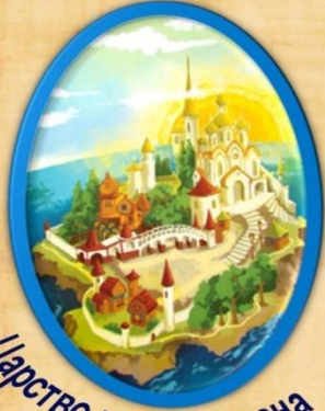
Царство царя Салтана