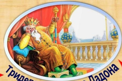
Тридешатое царство Дадона