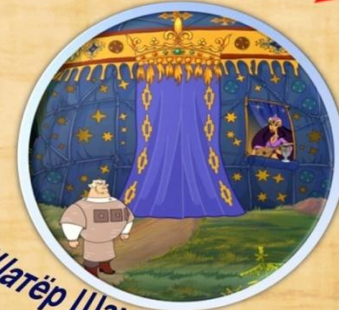
Шатёр Шамаханской царицы