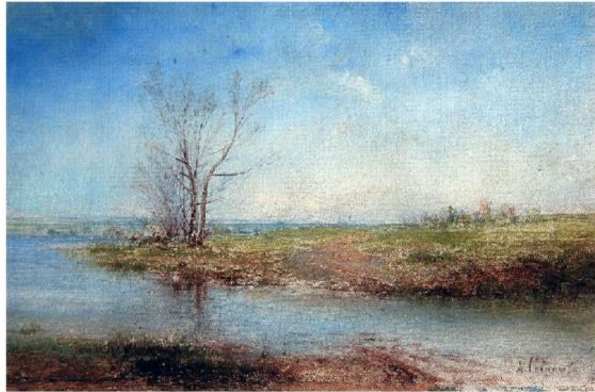
Ф.И.ТЮТЧЕВ «ВЕСЕННИЕ ВОДЫ».

Еще в полях белеет снег, А воды уж весной шумят — Бегут и будят сонный брег, Бегут и блещут и гласят... Еще в полях белеет снег, А воды уж весной шумят — Бегут и будят сонный брег, Бегут и блещут и гласят... Они гласят во все концы: «Весна идет, весна идет! Мы молодой весны гонцы, Она нас выслала вперед!» Весна идет, весна идет! И тихих, теплых, майских дней Румяный, светлый хоровод Толпится весело за ней.