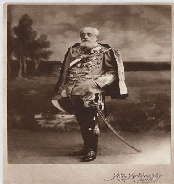
Старший сын А.С. Пушкина

Старший сын Александра Сергеевича и Наталии Николаевны Пушкиных родился 6 июля 1833 года в Санкт - Петербурге. Выпускник Петербургского Императорского Пажеского Корпуса. Избрал профессиональную карьеру военного. Дослужился до чина генерал - майора. Командовал 13 -ым гусарским Нарвским полком, принимавшим участие в боях за освобождение Болгарии, и первой бригадой 13 - ой кавалерийской дивизии, входившей в личную свиту Императора. Награжден золотой георгиевской саблей "За храбрость" и орденом Владимира 4 - ой степени с мечами и бантом. Скончался 19 июля 1914 года в селе Малое Останкино (под Москвой) в возрасте 83 лет.