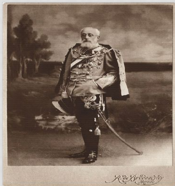
Старший сын А.С. Пушкина

Старший сын Александра Сергеевича и Наталии Николаевны Пушкиных родился 6 июля 1833 года в Санкт - Петербурге. Выпускник Петербургского Императорского Пажеского Корпуса. Избрал профессиональную карьеру военного. Дослужился до чина генерал - майора. Командовал 13 -ым гусарским Нарвским полком, принимавшим участие в боях за освобождение Болгарии, и первой бригадой 13 - ой кавалерийской дивизии, входившей в личную свиту Императора. Награжден золотой георгиевской саблей "За храбрость" и орденом Владимира 4 - ой степени с мечами и бантом. Скончался 19 июля 1914 года в селе Малое Останкино (под Москвой) в возрасте 83 лет.