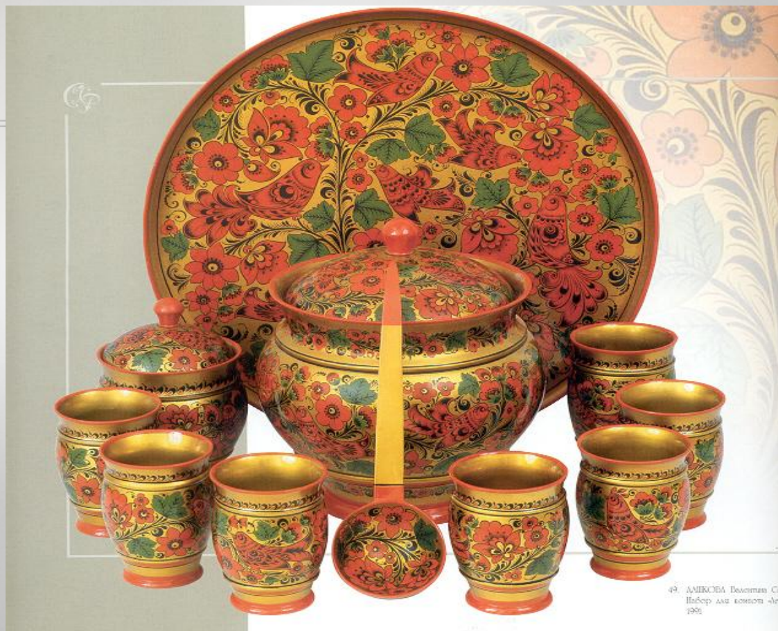
49. АМЕРСЕА Деланган С История для истории Ам 1990