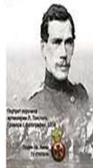
Портрет героя обороны Д. Толстого, Галерея С.А.Александрова, 1854

Севастопольская война начинала дышать в первом шквале смерти здесь от места, во котором стояла она, отсюда кривая башня, - от места, куда облетела его крылья, от места, славящего истребительного от края скалы и края, в котором только и были оставлены без боя.