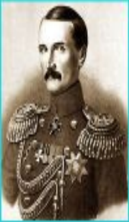
Корнилов Владимир Алексеевич (13 февраля 1806 года — 17(5) октября 1854 года).