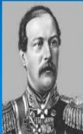
Тотлебен Эдуард Иванович (8(20).5.1818, — 19.6(1.7).1884).

по пути в Севастополь Л.Н. Толстой, отстав от своей батареи, объездив части Крымской армии, увидел карьеризм царских генералов и убедился, что «Россия или должна пасть или совершенно преобразиться». Он встречался и говорил с Нахимовым, Истоминым, Тотлебенем.