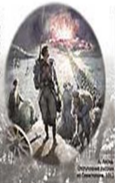
А. Монахов. Случайный эпизод из Севастополя, 1855