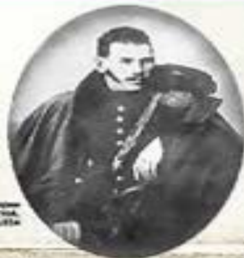
Портрет артиллера графа Толстого. Дрезден, 1834

Двадцать лет (1812 и в 1813) я служил в артиллерии на Кавказе. Там я видел много интересного: как строили крепости, как вели войну, как жили в войсках, как работали артиллеристы, и много, — по описанию в «Воспоминаниях» и «Записках» Пушкина, Гоголя и др.