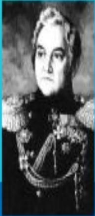
Лазарев Михаил Петрович (3 (14).11.1788. — 11 (23).04.1851).