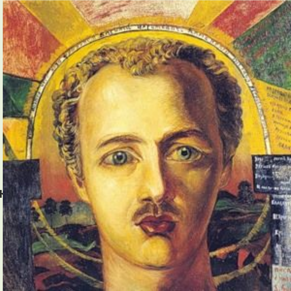
Д. Бурлюк. Портрет поэта-футуриста Василия Каменского (1917)

И он — Поэт, и Принц, и Нищий, Колумб, Острило, и Апаш, Кто в Бунте Духа смысла ищет — Владимир Маяковский наш.