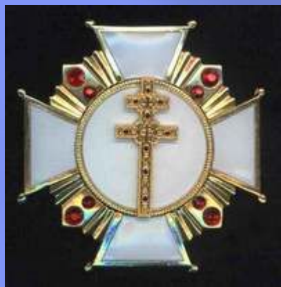
Ордэн Крыжа Прападобнай