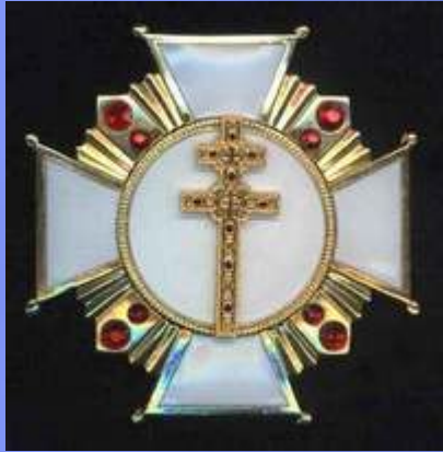
Ордэн Крыжа Прападобнай