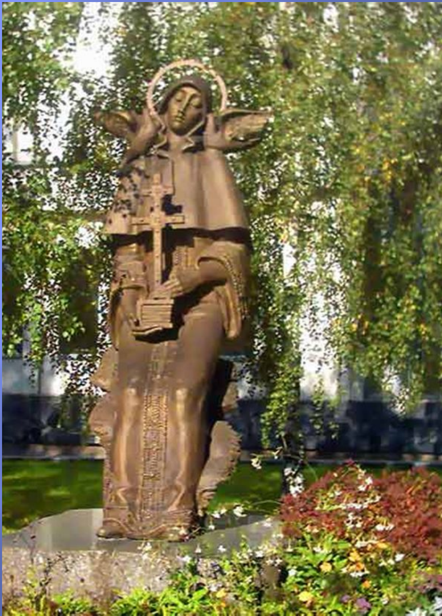
Помнік Еўфрасінні ў Мінску