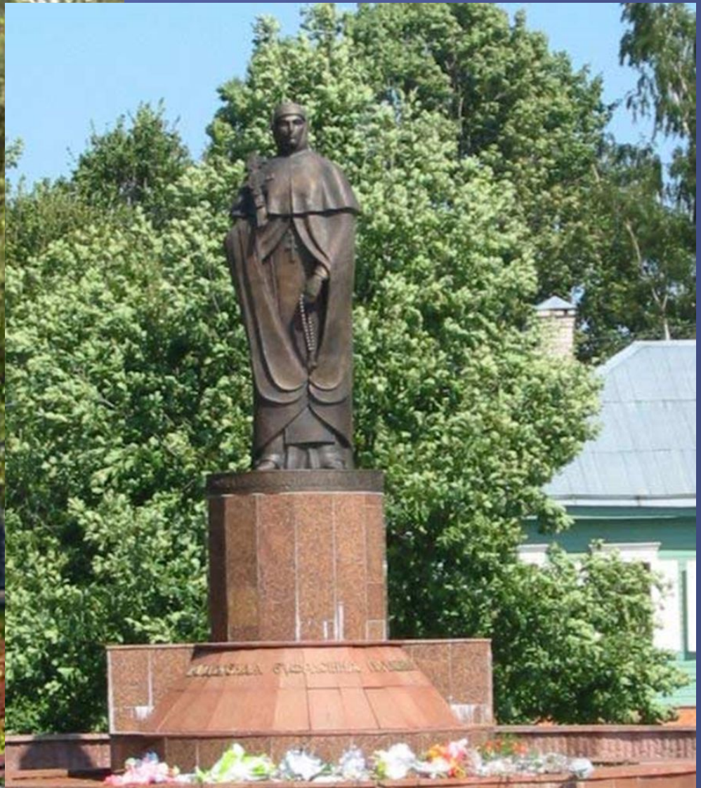
Помнік Еўфрасінні ў Полацку