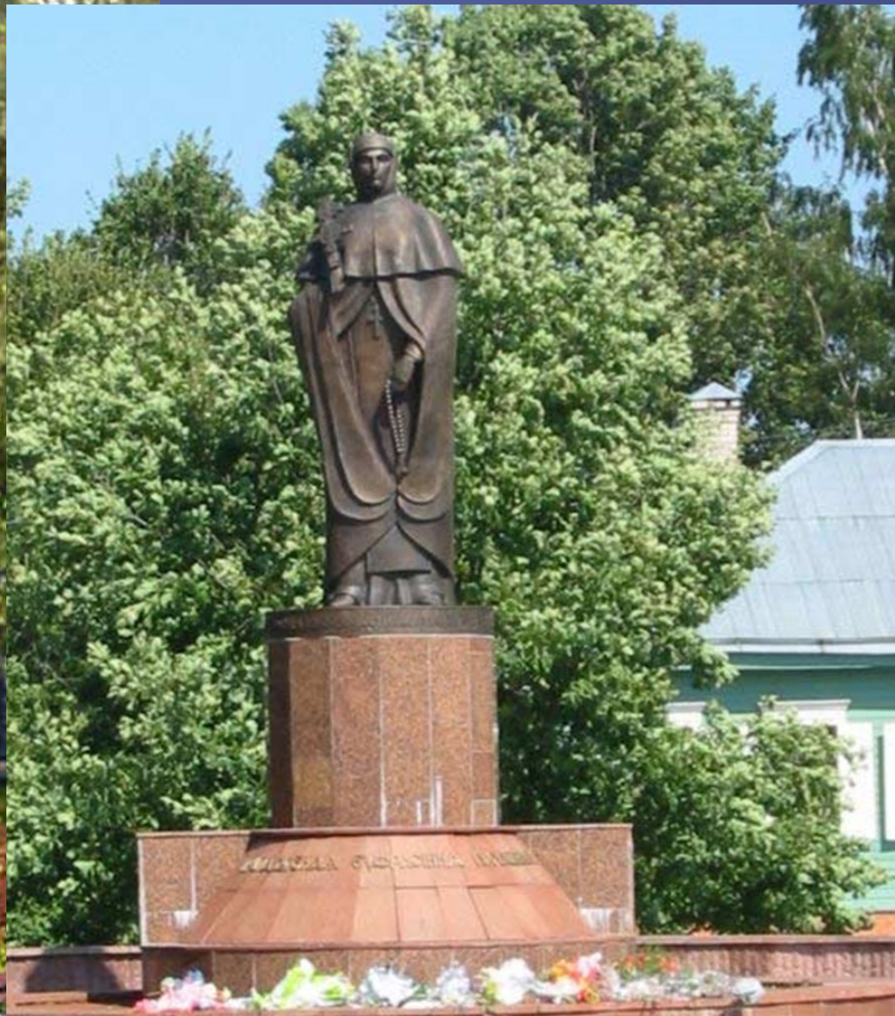
Помнік Еўфрасінні ў Полацку