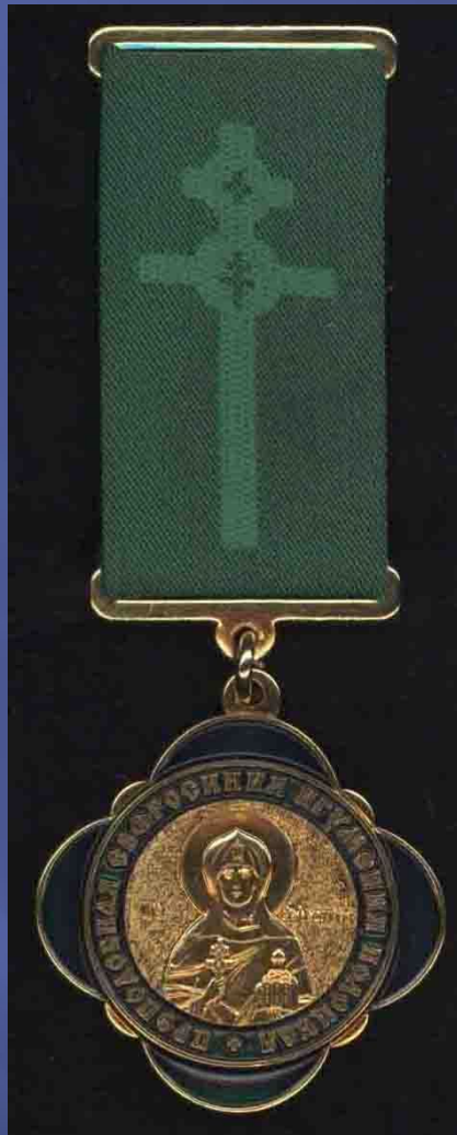
Медаль Святой Еўфрасінні Полацкай