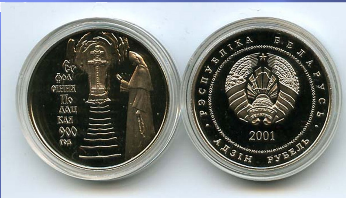
Памятныя манеты «900-годдзе Еўфрасінні Полацкай