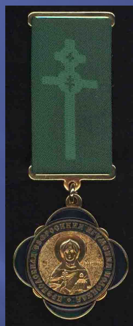
Медаль Святой Еўфрасінні Полацкай