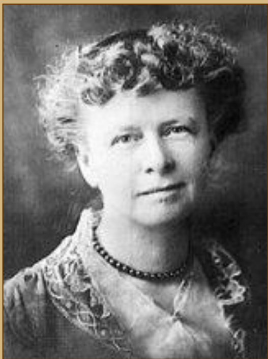
Элеанор Потер (1868 - 1920)

Родилась в городе Литтлтон, Нью Гемпшир. В основном писала книги для детей и самой известной стала «Поллианна»