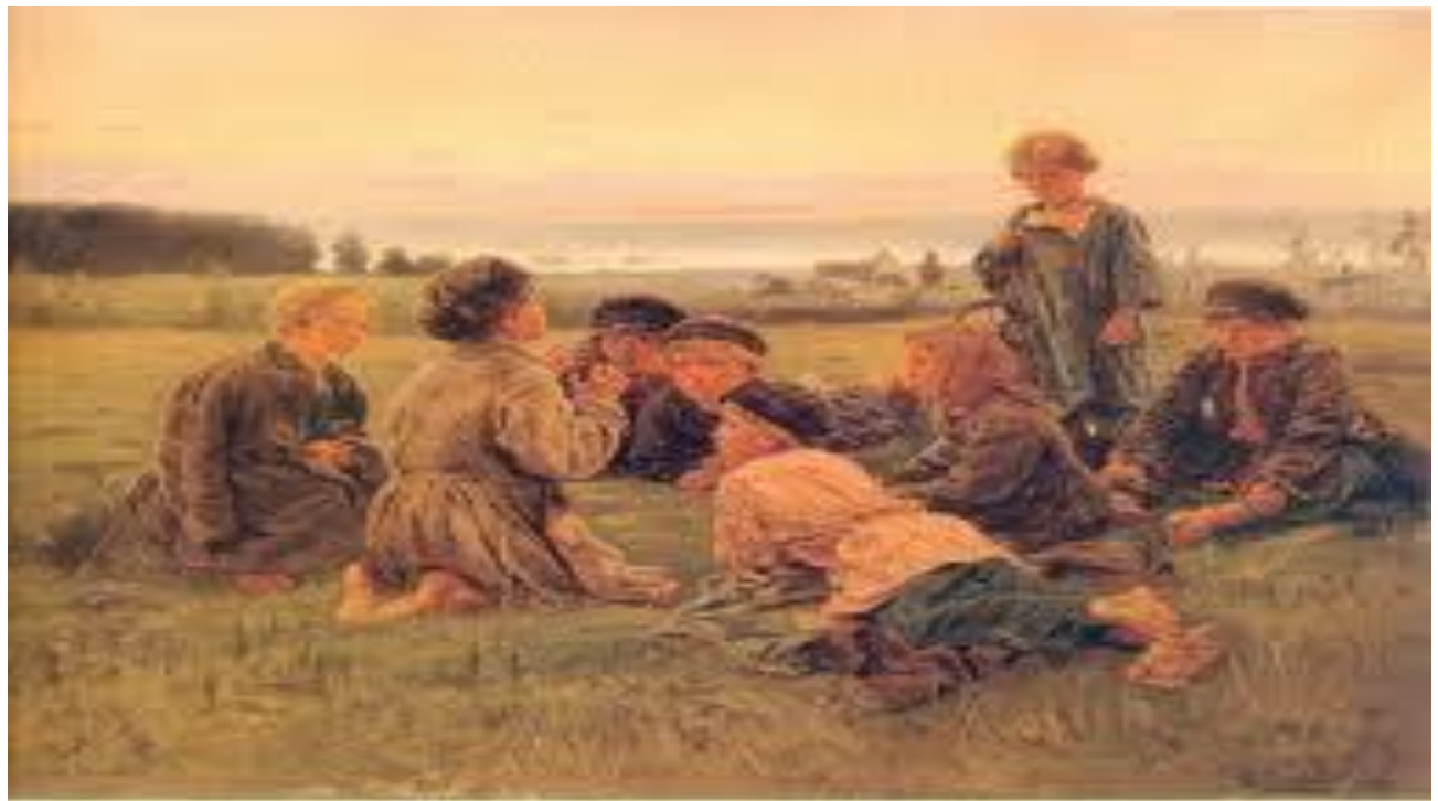
В. Е. Мазовский. Ночь. 1872. Холст, масло.