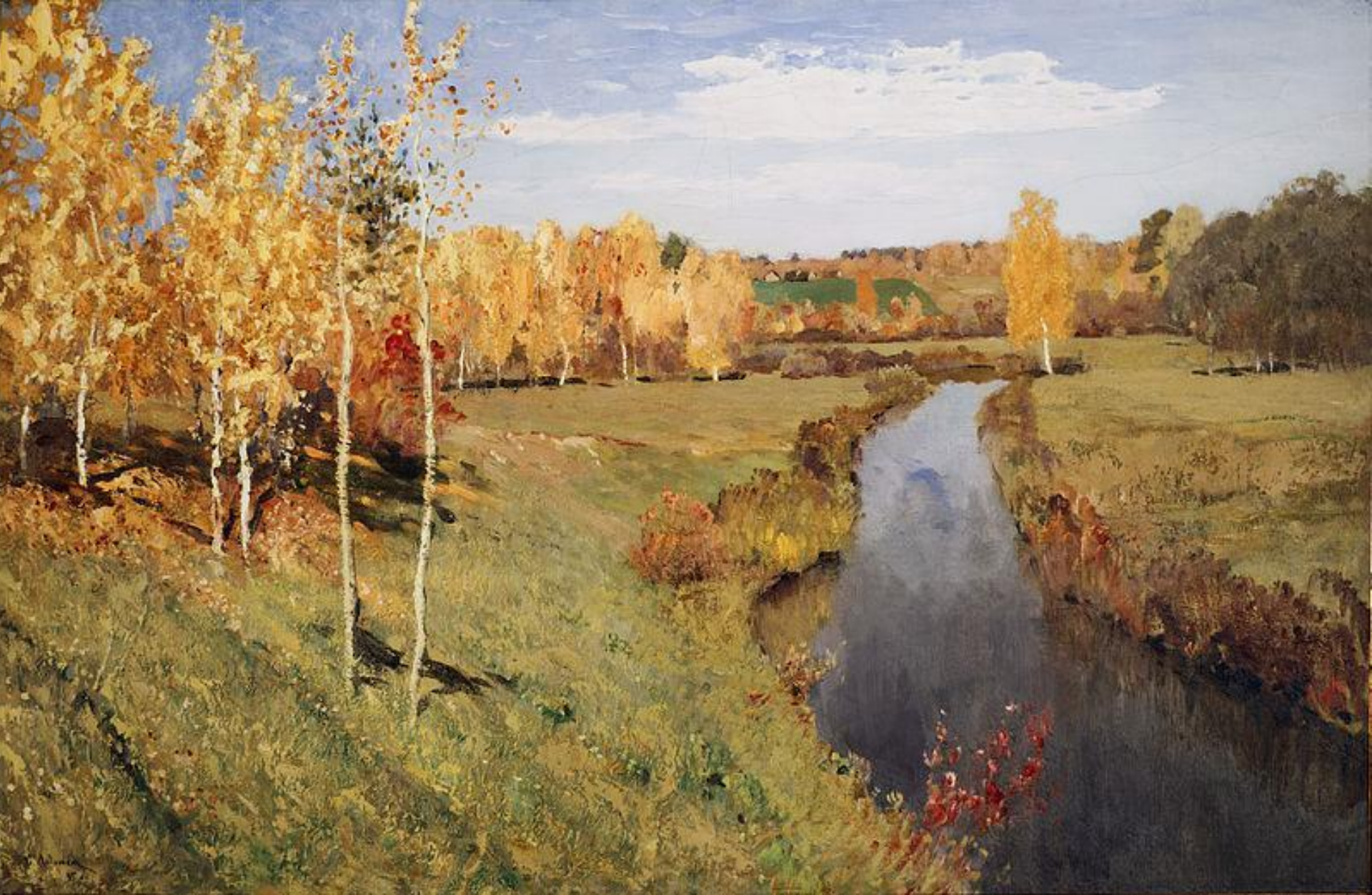
І. Левітан. Золота осінь. 1895