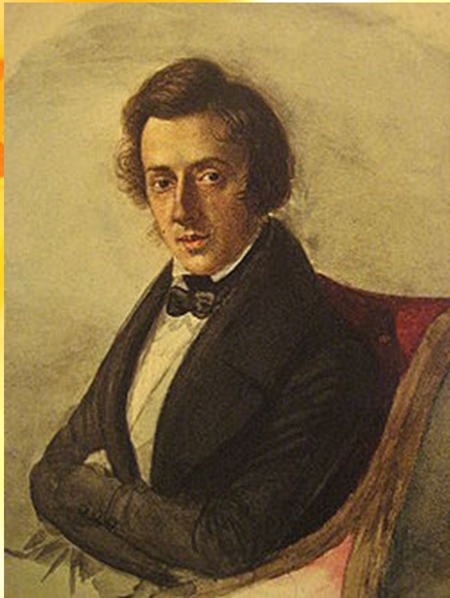
Ф. Шопен (1810-1849), польский композитор