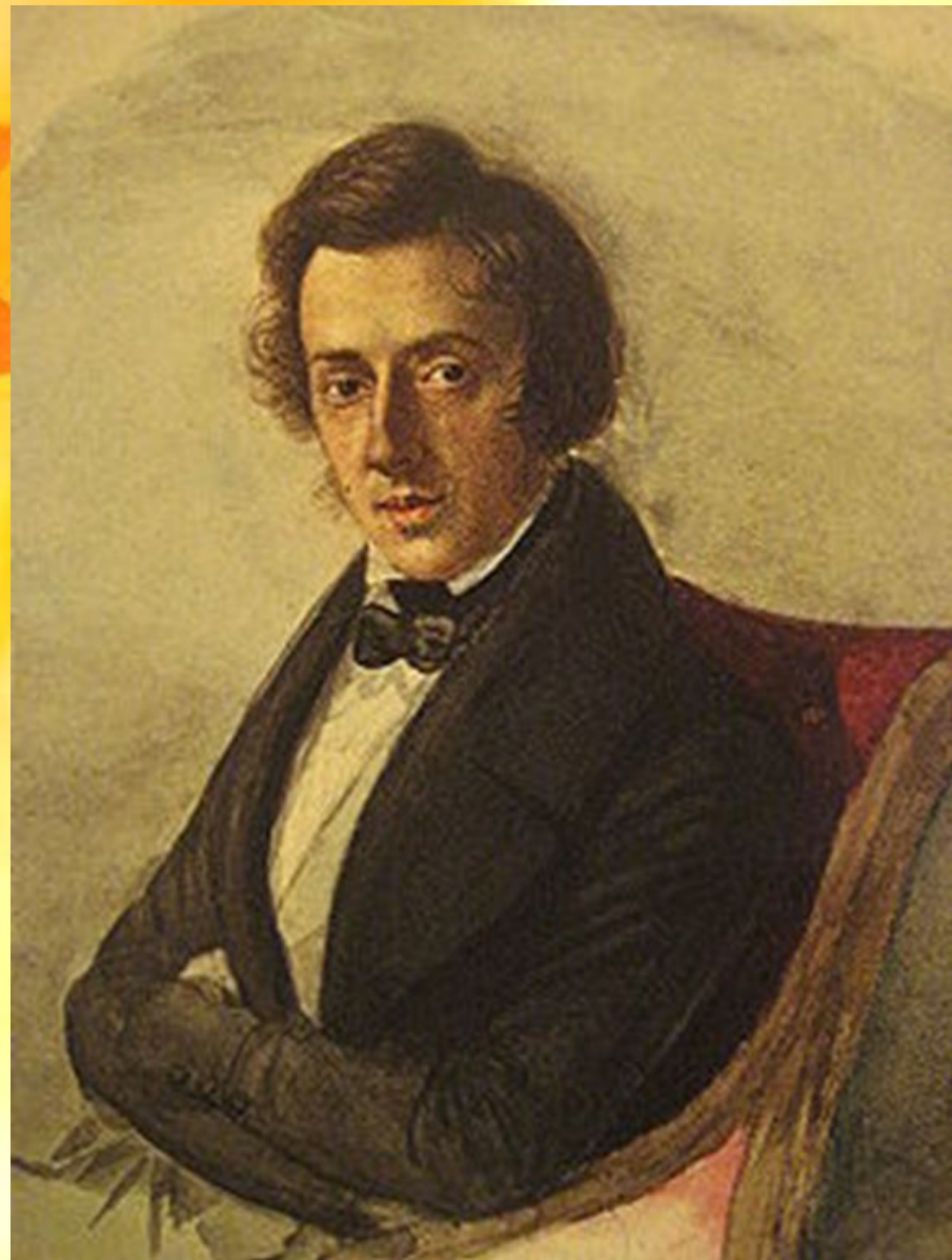
Ф. Шопен (1810-1849), польский композитор