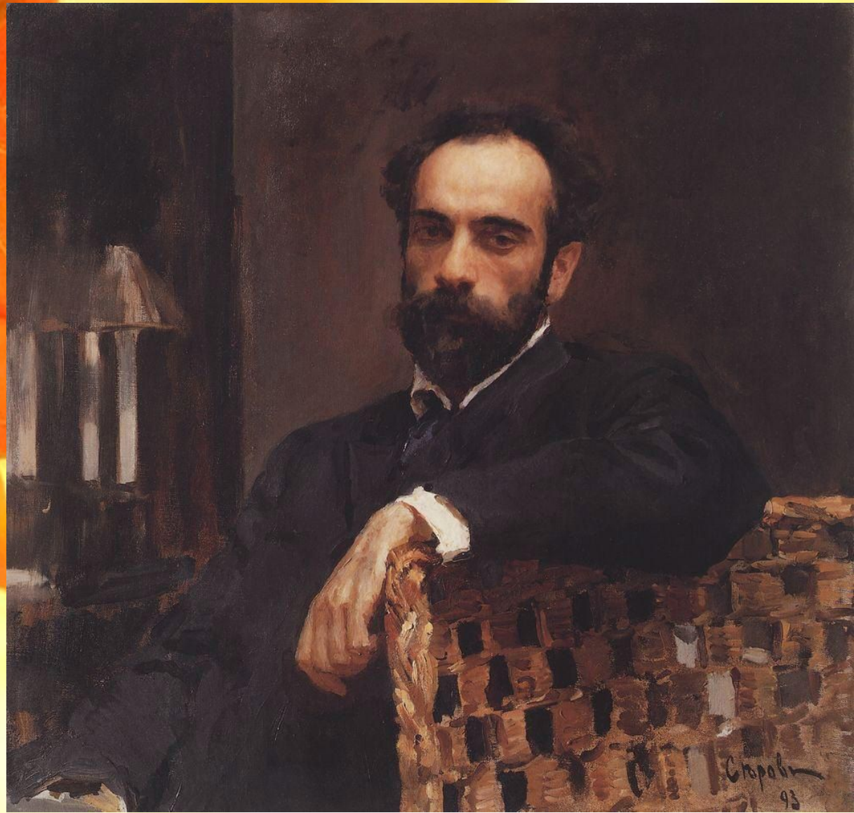
І. Левітан (1860-1900), російський художник