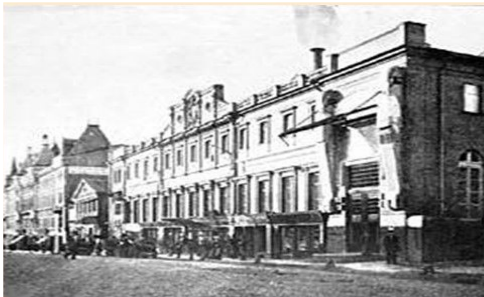
МХАТ имени А.П.Чехова

Подробнее: http://obrazovaka.ru/apha/c/chexov-anton-pavlovichchekhov-anton-pavlovich#ixzz4xPU20hUj