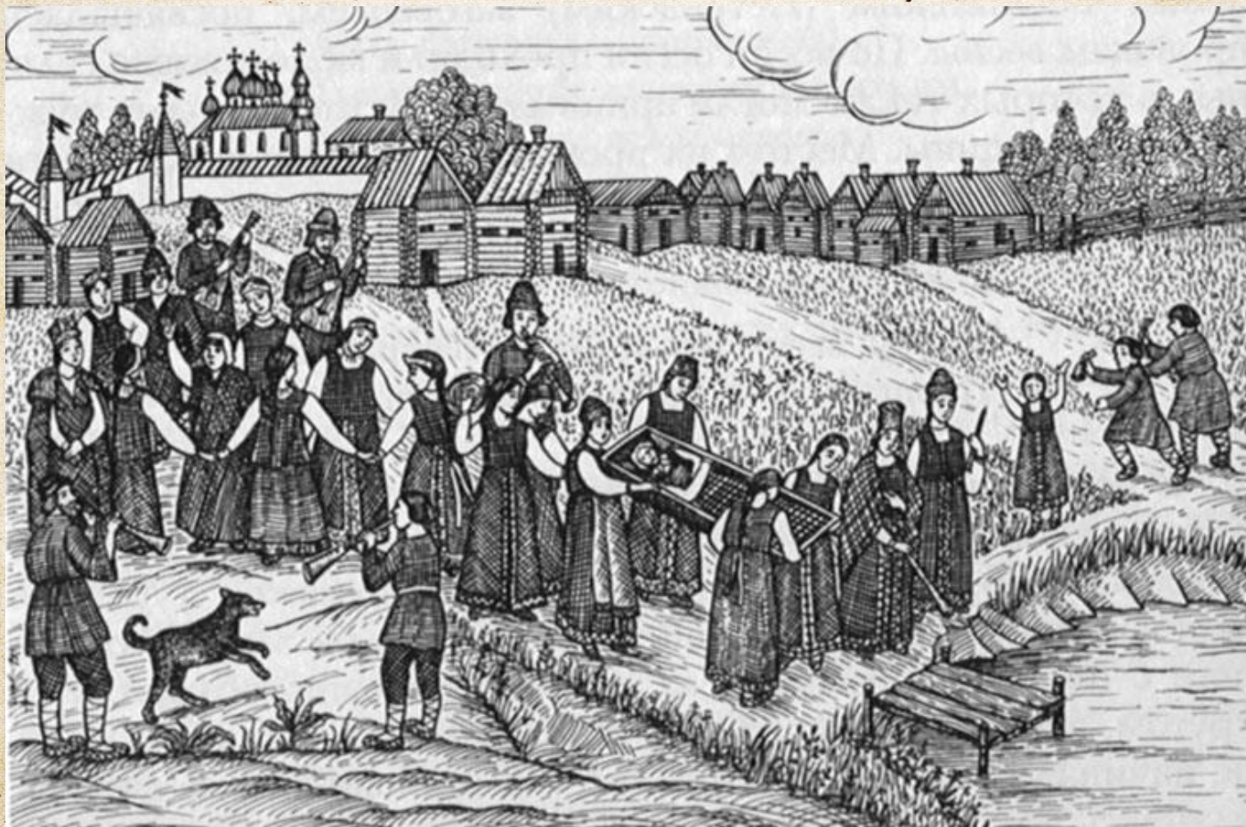
Проводы Костромы. Топление чучела