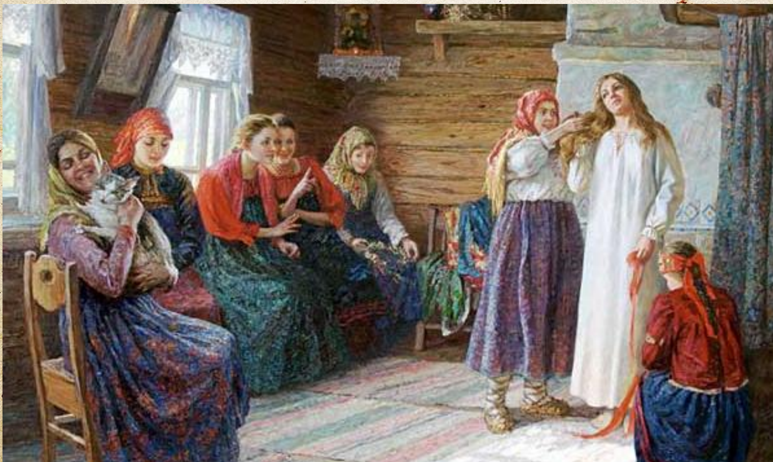
Подготовка невесты к свадьбе