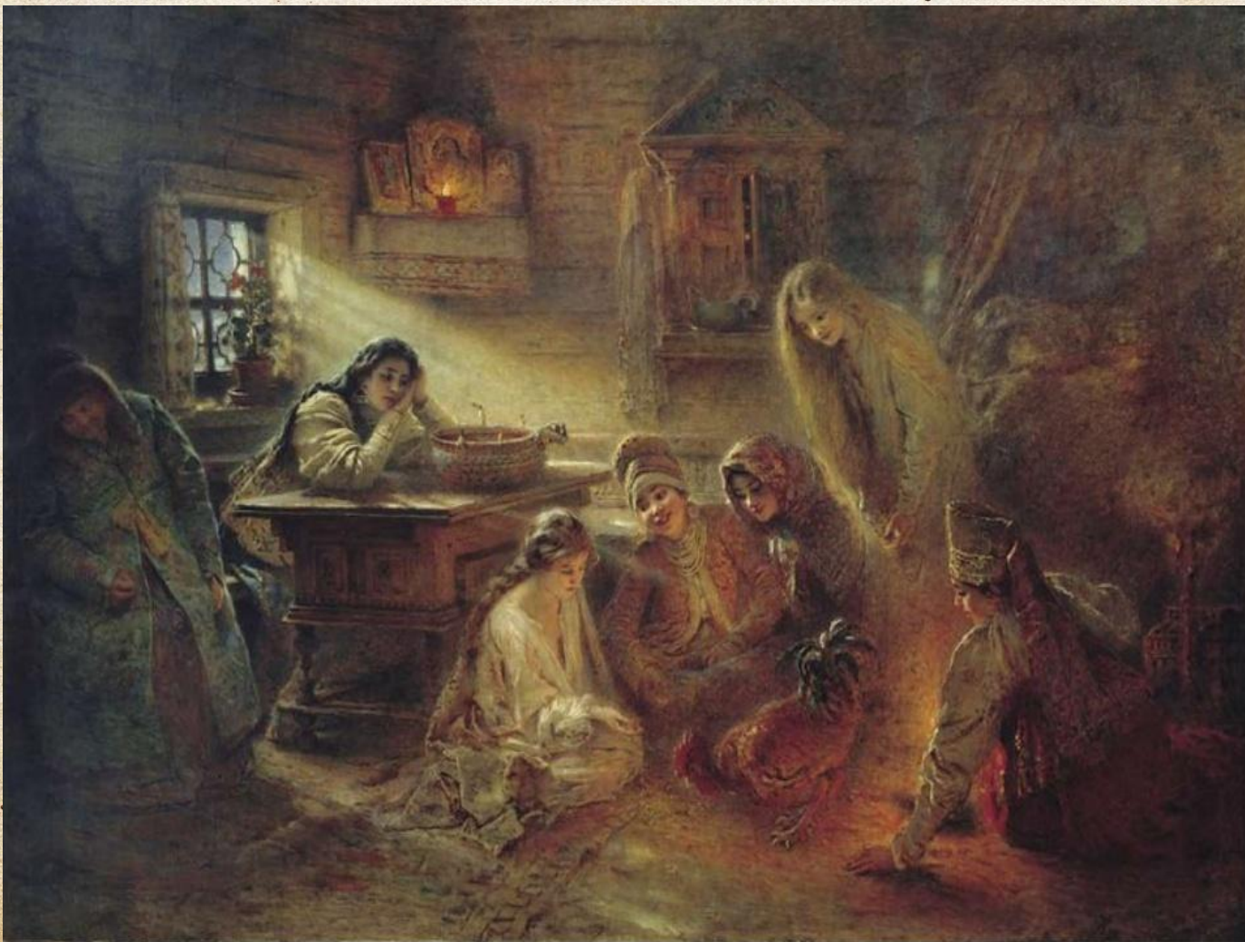
Гадание на курице