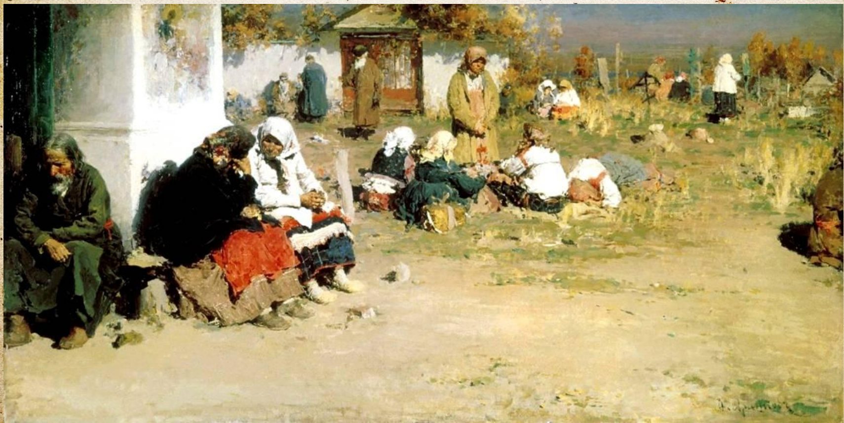
Картина А.Е. Архипова. Радоница (Перед обедней)