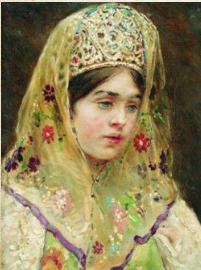
Образ русской невесты