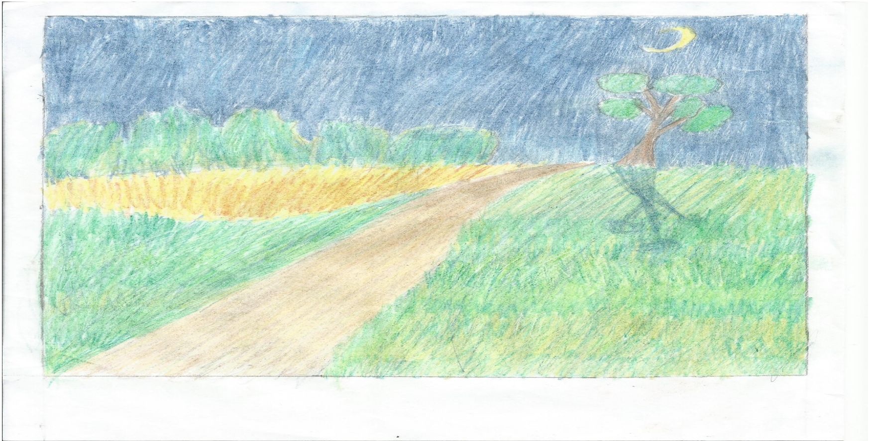
Иллюстрация к стихотворению «Месяц задумчивый, полночь глубокая»