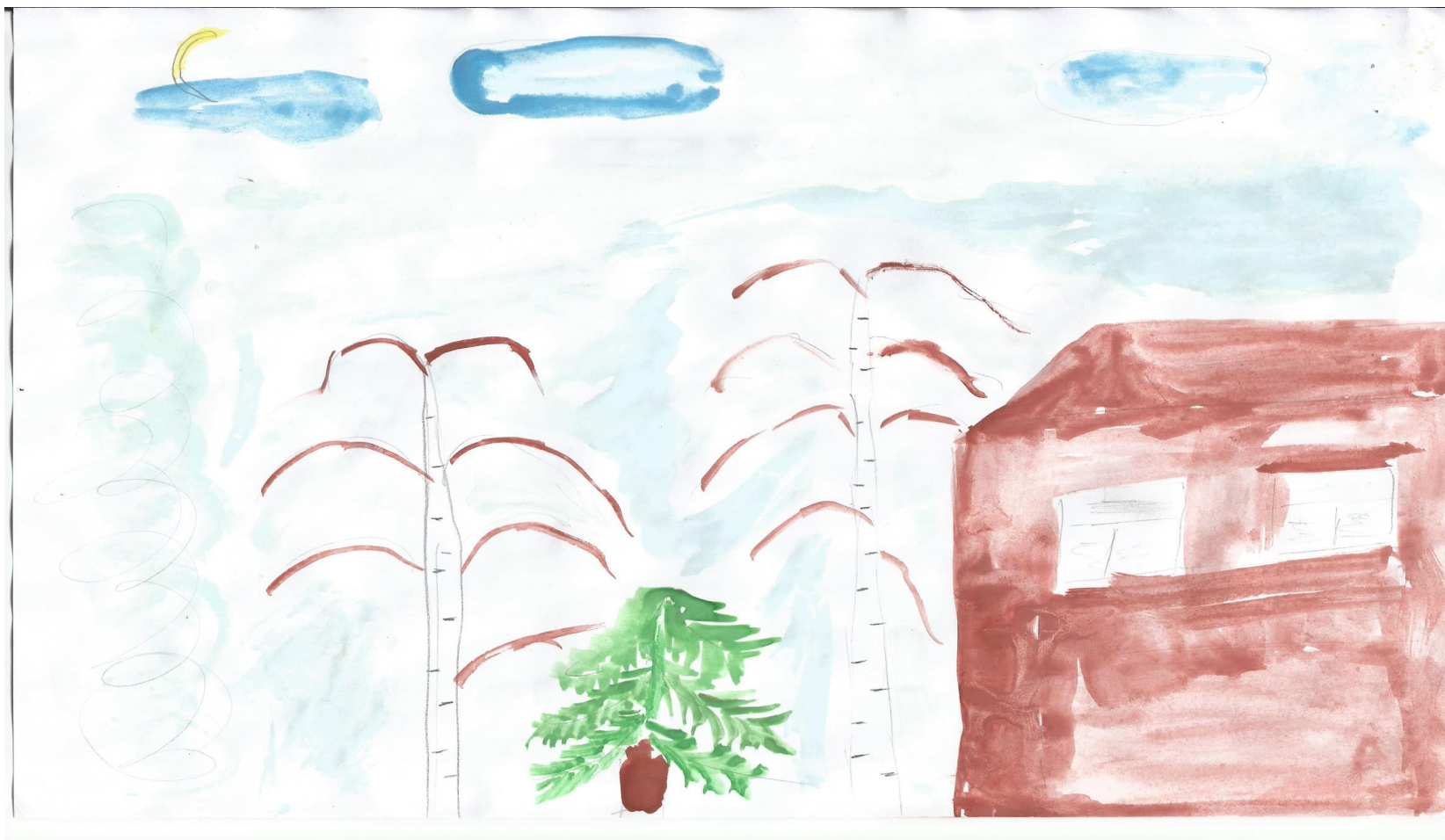
Иллюстрация к стихотворению «Метель»