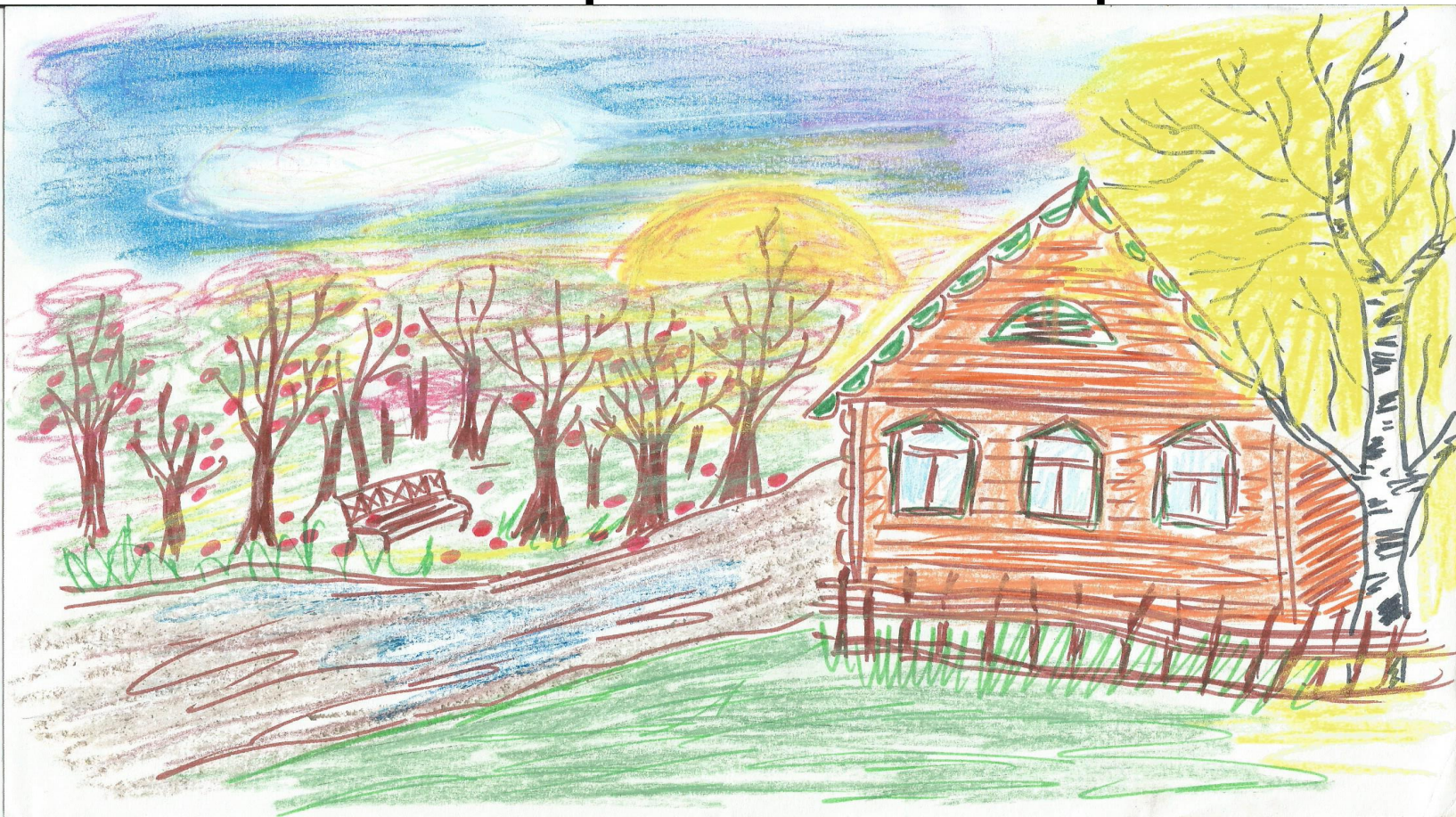
Иллюстрация к стихотворению «Вечер»