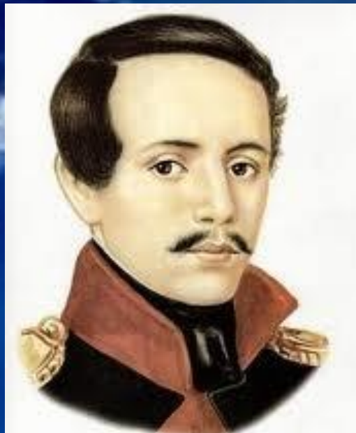
Лермонтов Михаил Юрьевич (1814-1841)