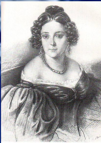
И. Ф. Иванова. Рис. В. Виллемана