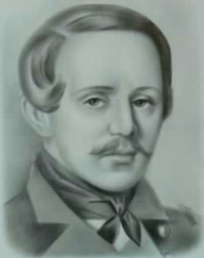
Михаил Лермонтов (1814—1841)