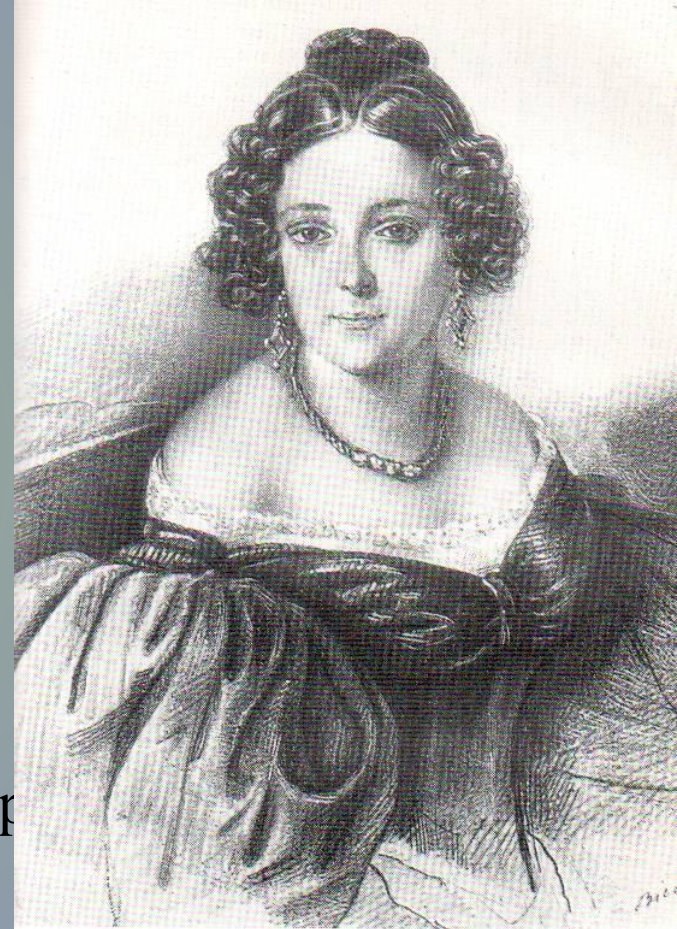
Н. Ф. Иванова. Рис. В. Биннемана