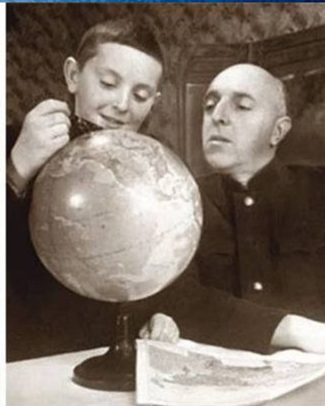
С отцом, 1951 г.