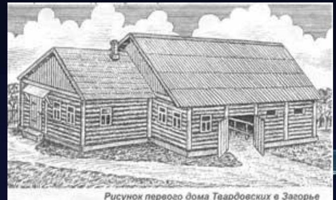
Рисунок первого дома Твардовских в Загорье