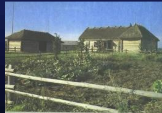
Хутор Загорье. Музей Твардовского

В 1988 году открыт для посетителей возрожденный хутор Загорье, место, где родился и жил до восемнадцатилетнего возраста Александр Трифонович Твардовский - выдающийся советский поэт. По макету брата поэта Ивана Трифоновича были заново возведены: дом, сарай, баня, кузница и другие надворные постройки, разбит сад и огород. Представленная в интерьере дома мебель тоже выполнена руками брата поэта - мастера - краснодеревщика. Большую помощь в оформлении дома, хозяйственных помещений, кузницы оказали жители деревень, передавшие музею предметы - быта, характерные для того времени. Неброская русская природа и обстановка, окружавшая мальчика, позволяют проникнуться атмосферой, в которой зарождался талант