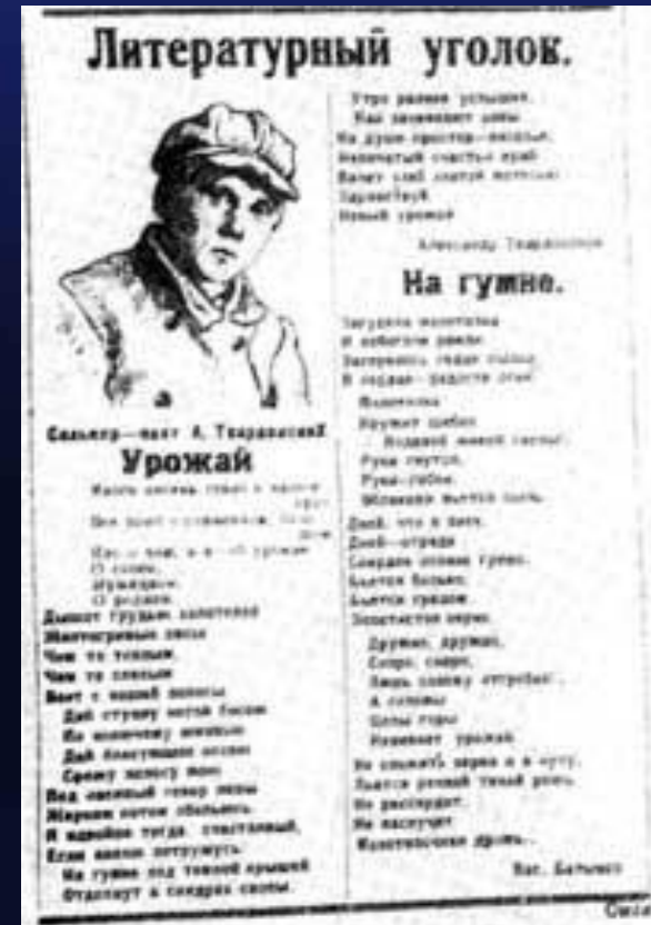
Первое опубликованное стихотворение. Газета "Смоленская деревня". 1925г.

«Отрываясь от книг и учебы,— вспоминает Твардовский, — я ездил в колхозы в качестве корреспондента областных газет, писал статьи, вел всякие записи. За каждой поездкой отмечая для себя то новое что открылось мне в