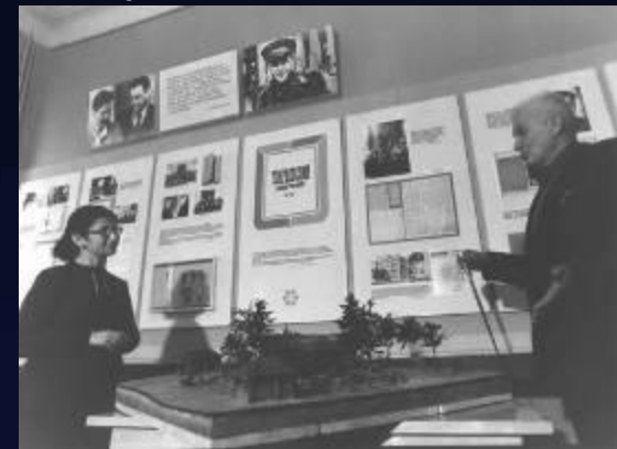
В музее Твардовского