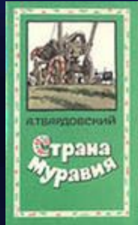
Иллюстрация к поэме «Страна Муравия»

Земля в длину и ширину – Кругом своя. Посеешь бубочку одну, И та - твоя.