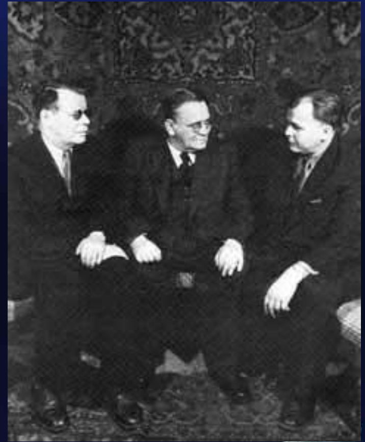
М. Исаковский, С. Маршак, А. Твардовский. 1953г