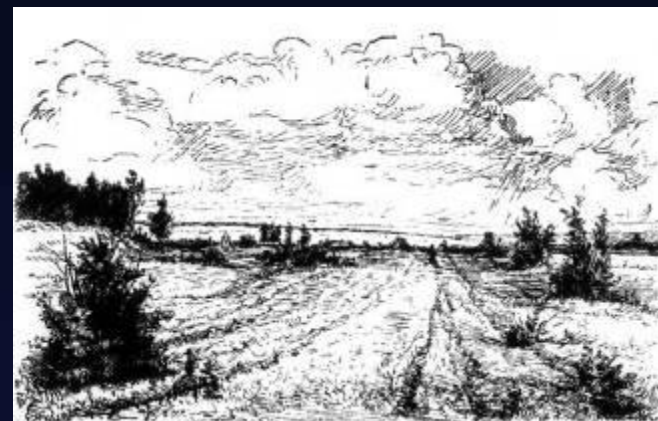
Иллюстрация к поэме «Страна Муравия», 1936г