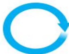
«круг»; «коло»; «колесо» — Смоленская обл. «шина» — Архангельская обл.