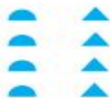
«колонна»; «шествие» — Архангельская обл.