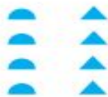
«колонна»; «шествие» — Архангельская обл.