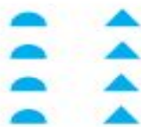
«колонна»; «шествие» — Архангельская обл.