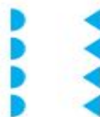
«улица» — Архангельская обл. «стенка» — Москва «проулочек» — Пермь