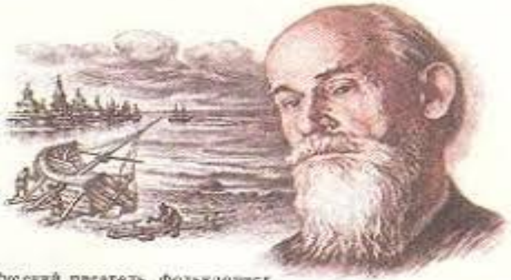
Русский претель, фольклорист Н. В. ШЕРГИН • 1893—1973