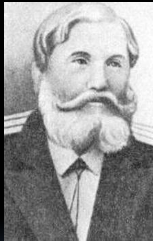
Отец Степан Яковлевич Гумилёв (28 июля 1836 — 6 февраля 1910).