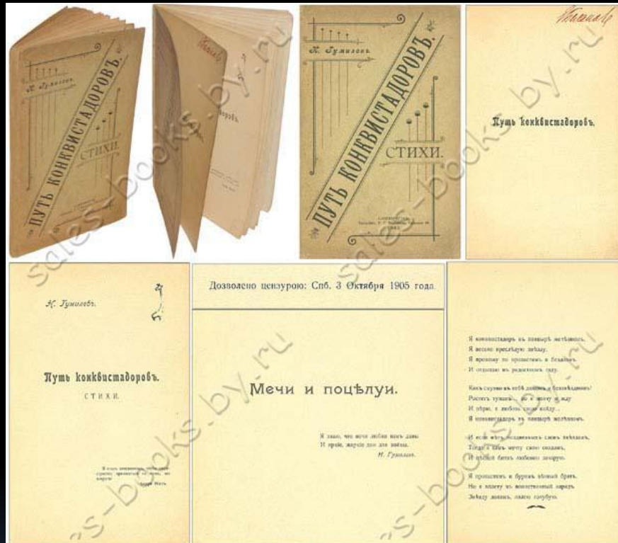
«Путь конквистадоров» 1905года