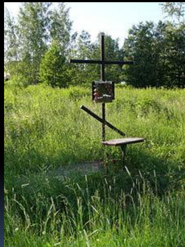
Крест-кенотаф в вероятном месте расстрела Гумилёва. Бернгардовка