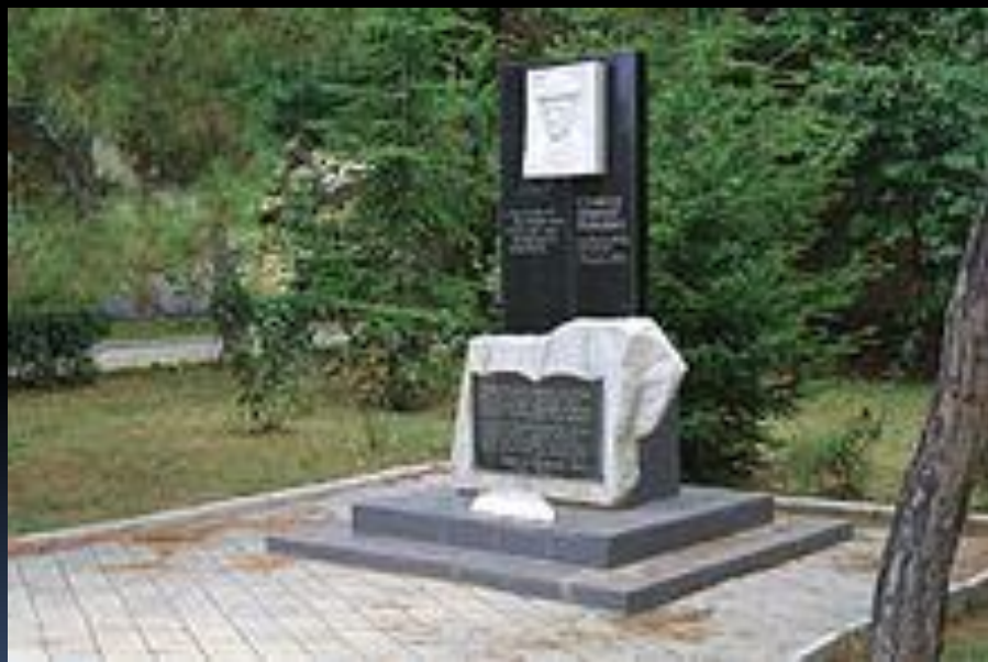
Памятник Николаю Гумилёву Коктебель