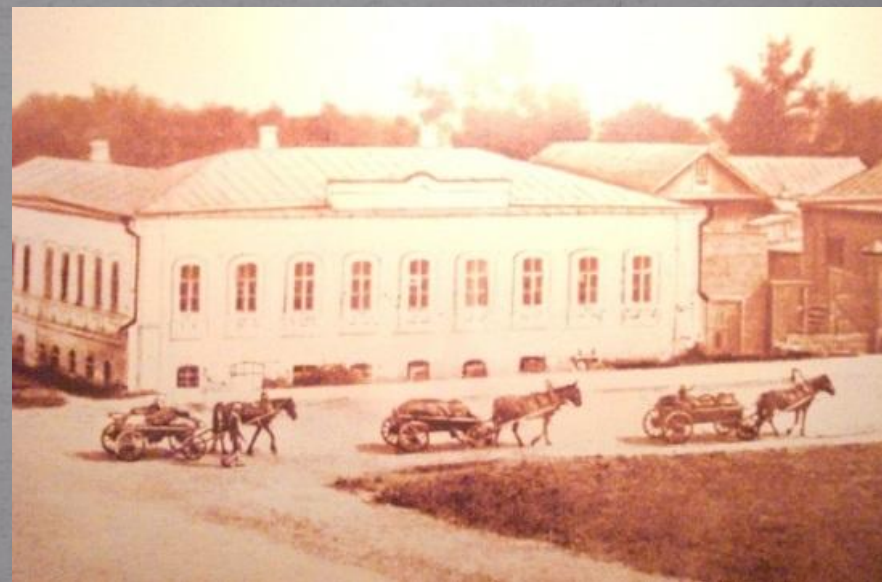
Вид старого Наровчата