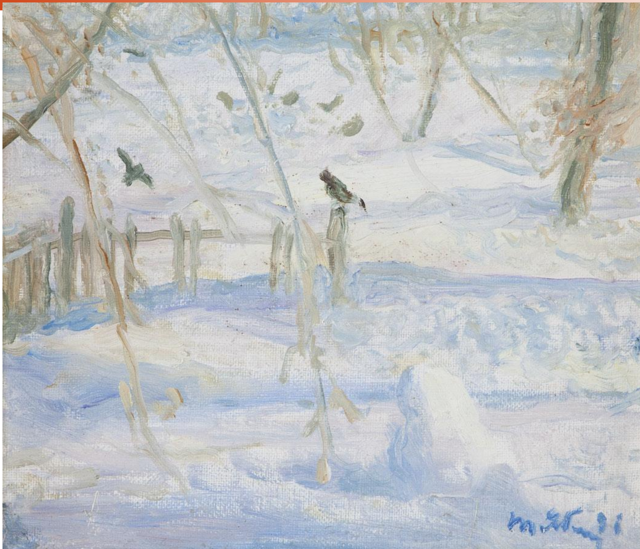
«Мороз и солнце» (1996)