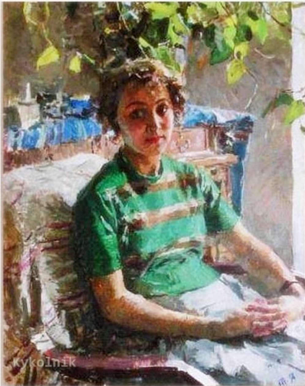
«Портрет девушки» (1958)