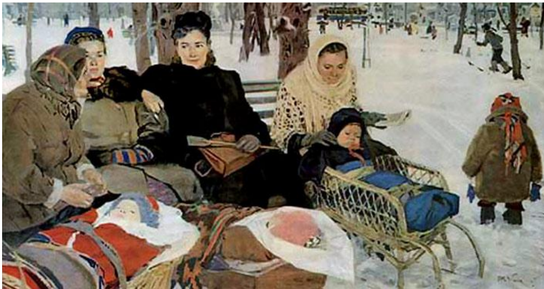
«В парке» (1950)