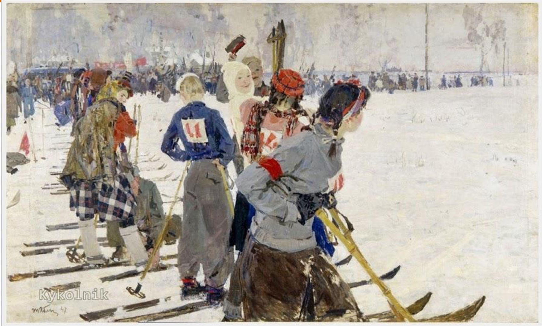
«Перед стартом» (1947)