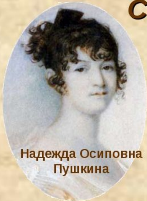
Надежда Осиповна Пушкина