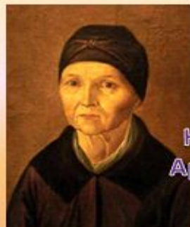
Няня А.Пушкина Арина Родионовна