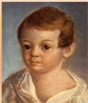
Маленький Сашенька Пушкин