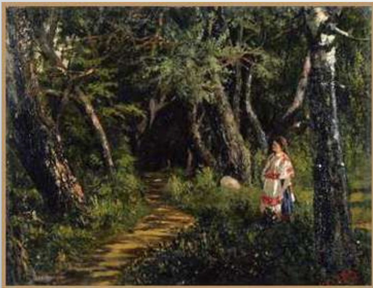
Дорожка в парке. Этюд Я.П. Полонского (масло), 1881