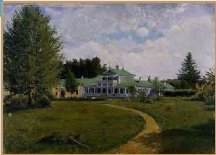
Усадебный дом Тургенева. Этюд Я.П. Полонского (масло), 1881