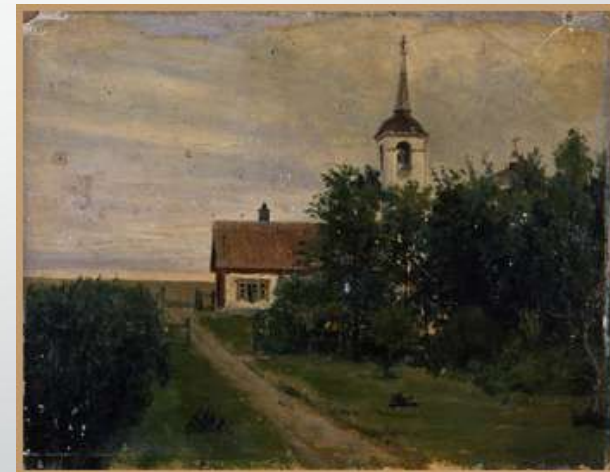
Церковь и школа. Этюд Я.П. Полонского (масло), 1881