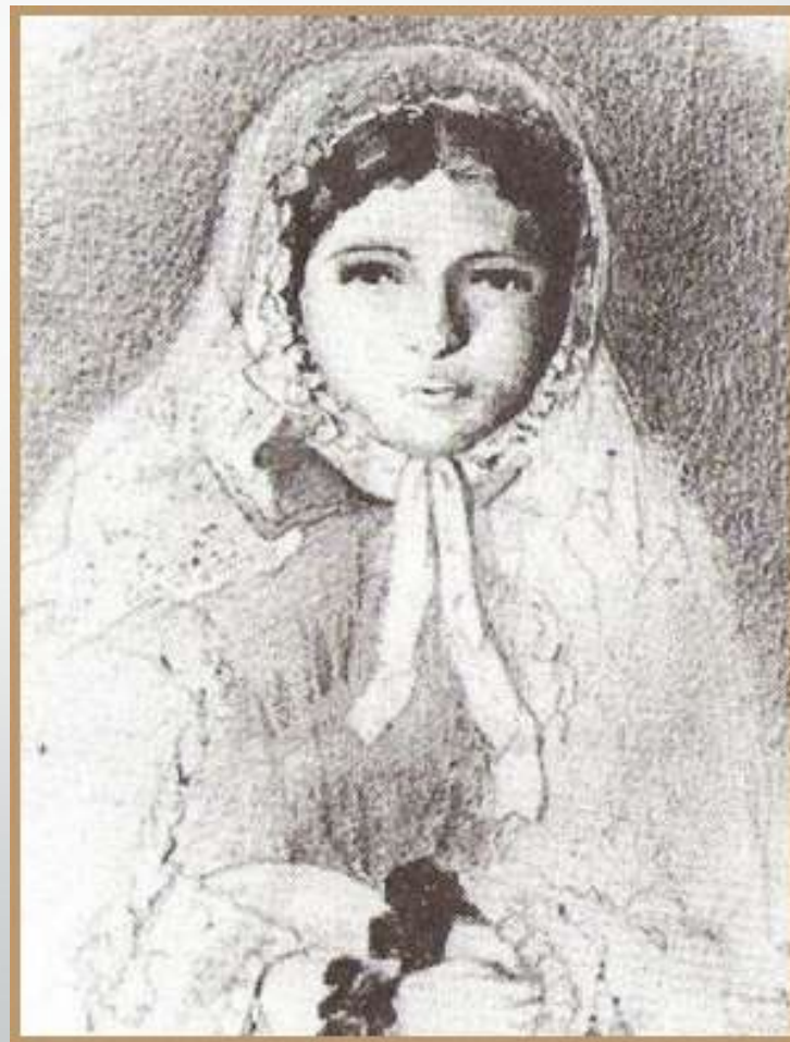
• Няня Я.П. Полонского Матрена. Рисунок Я.П. Полонского