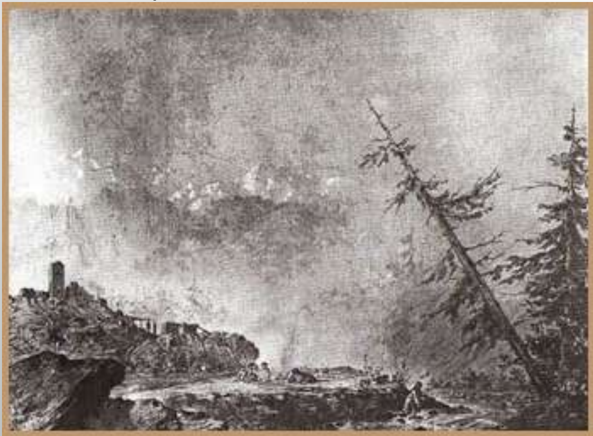
• Аул в долине. 1847-1850. Карандаш, белила

Также Яков Петрович увлекался живописью и рисованием. В основном работал в технике графики, рисуя карандашом, и создавая живописные полотна в технике масла. Полонский писал портреты, этюды, пейзажи окрестностей.