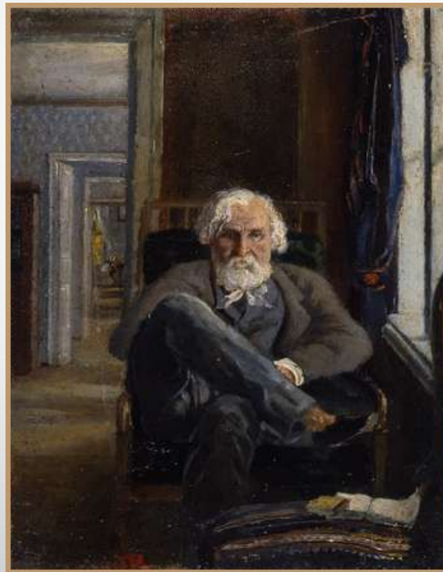
И.С. Тургенев. Портрет работы Я. П. Полонского (масло), 1881