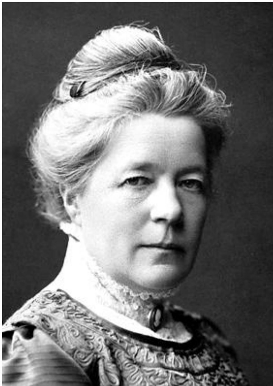
Сельма Оттилия Лувиса Лагерлеф