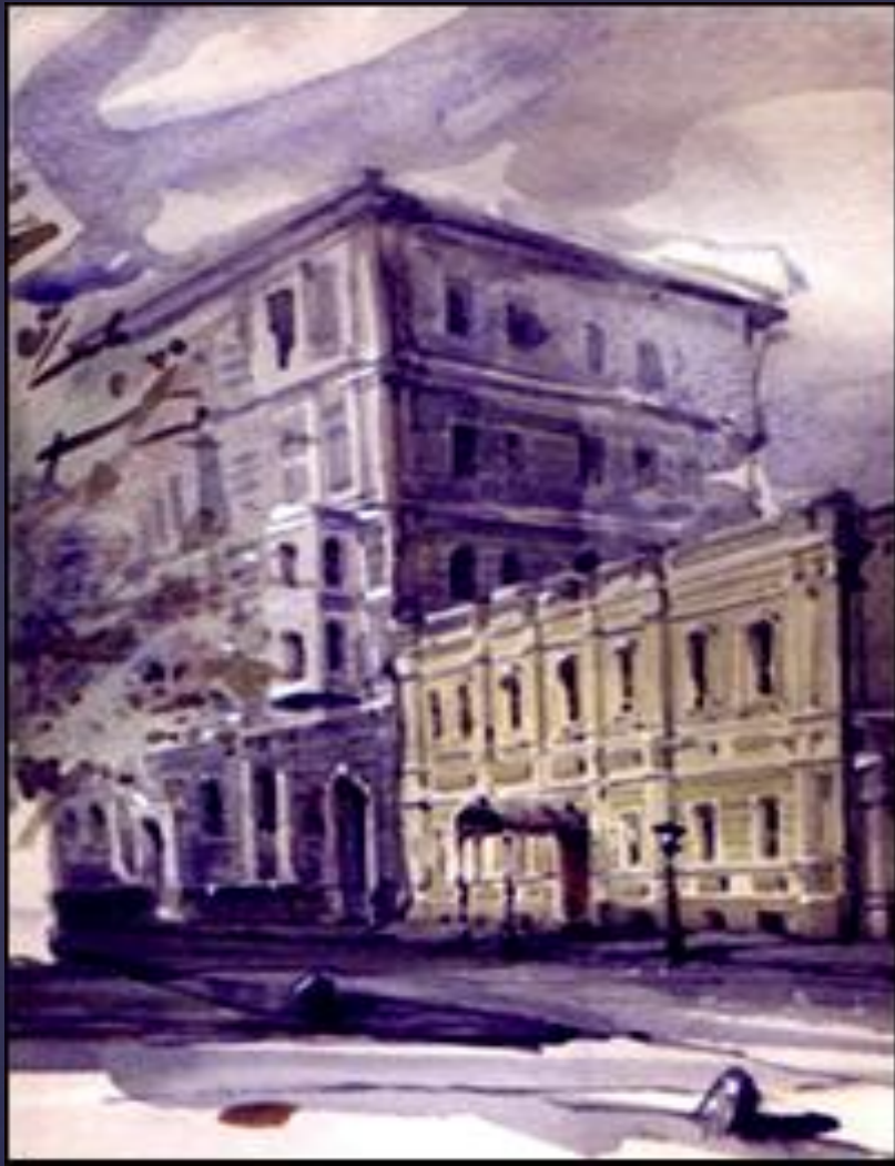
Москва Дом в Борисоглебском переулке

Красною нитью Рябина зажглась. Падали листья, Я родилась. Спорили сотни Колоколов, День был субботний: Иоанн Богослов, Мне и доньне Хочется грызть Жаркой рябины Горькую кисть.