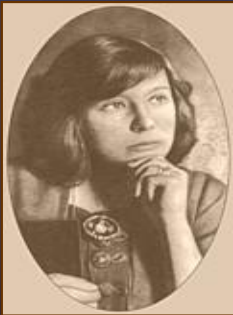
Марина Ивановна Цветаева (1892-1941гг.)