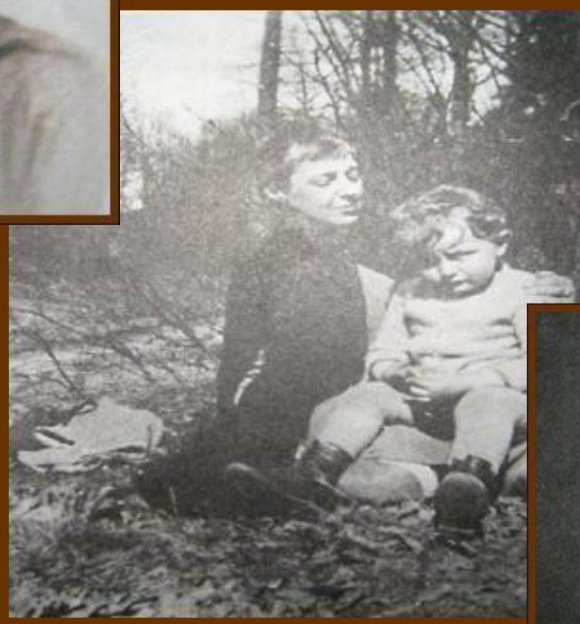
М.И. Цветаева с сыном Георгием.