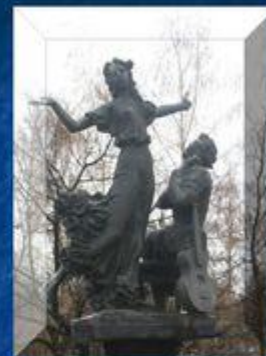
г. Орёл, памятник Н.С. Лескову и героям его произведений