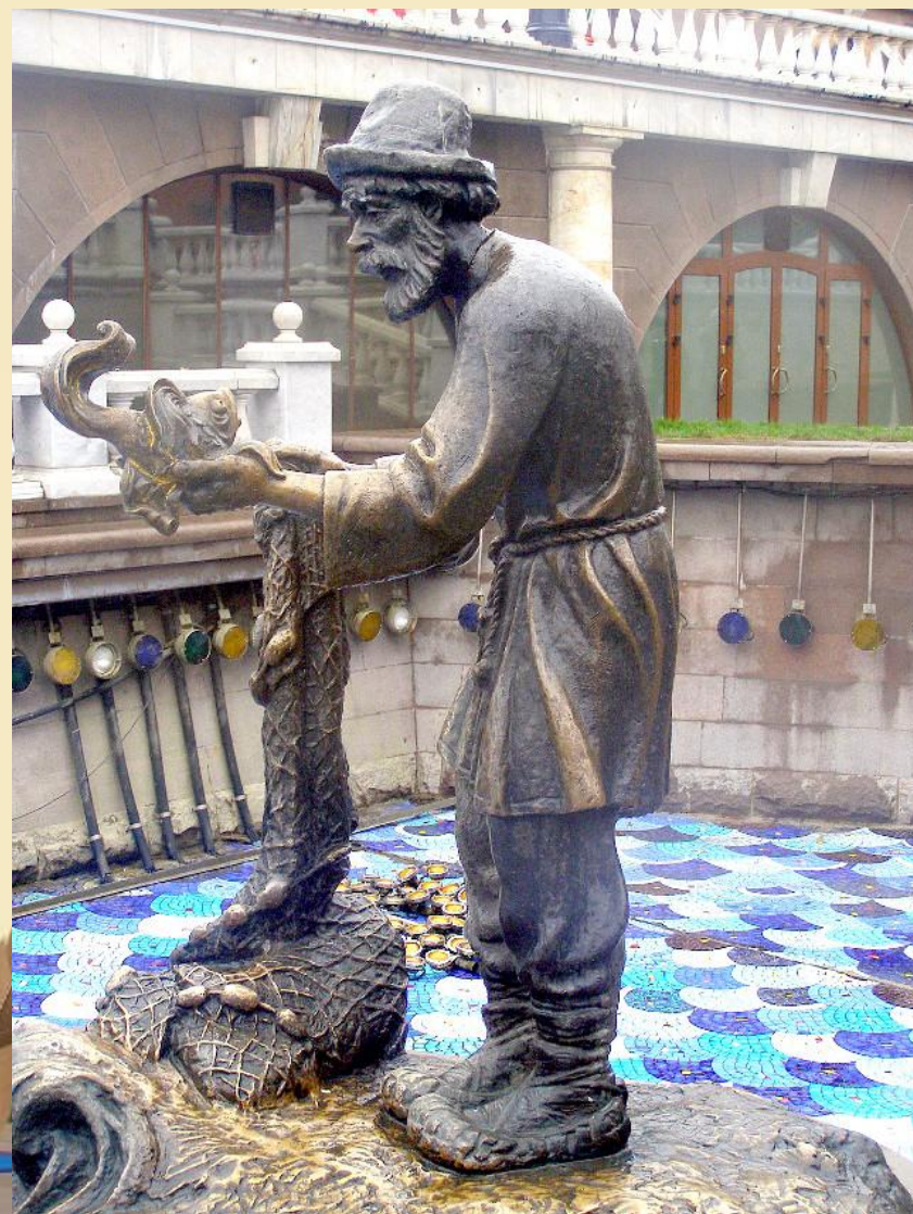
Манежная площадь. Скульптура старика с золотой рыбкой