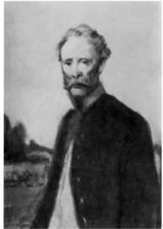
«Отцы и дети». Василий Иванович Базаров. Иллюстрация К. И. Рудакова. 1946–1947 гг.

Василий Иванович – гостеприимный хозяин, он с удовольствием встречает Аркадия, предлагает ему удобную комнату во флигеле.