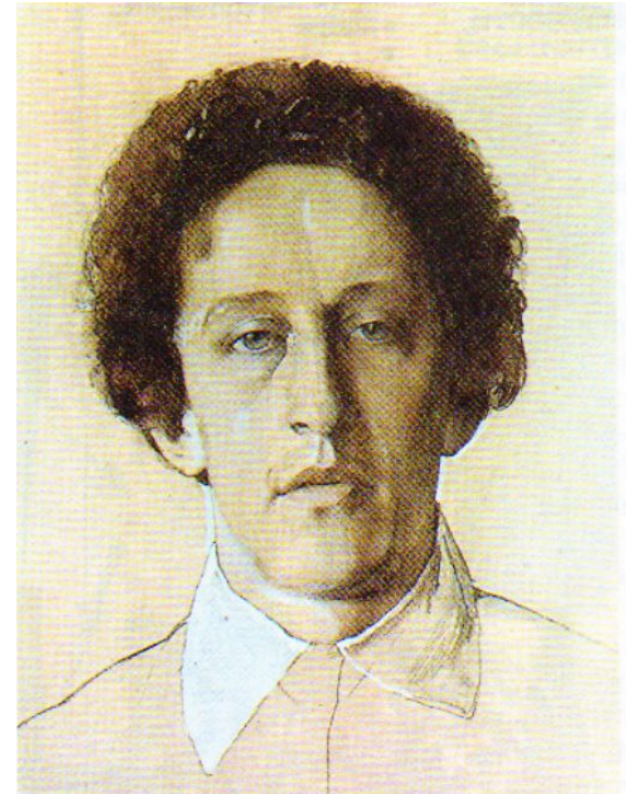
Портрет А. А. Блока 1907 г. К. А. Сомов