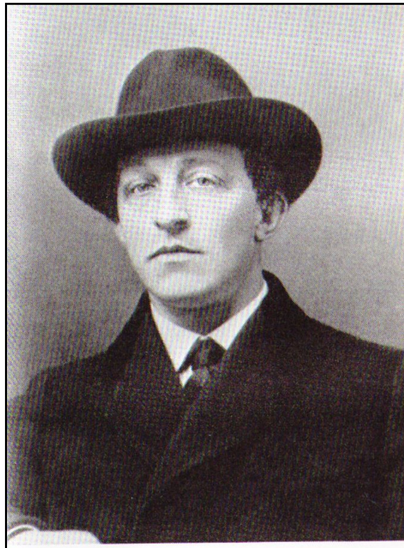
Александр Александрович Блок (1880—1921)

Испепеляющие годы! Безумья ль в вас, надежды ль весть? От дней войны, от дней свободы – Кровавый отсвет в лицах есть.