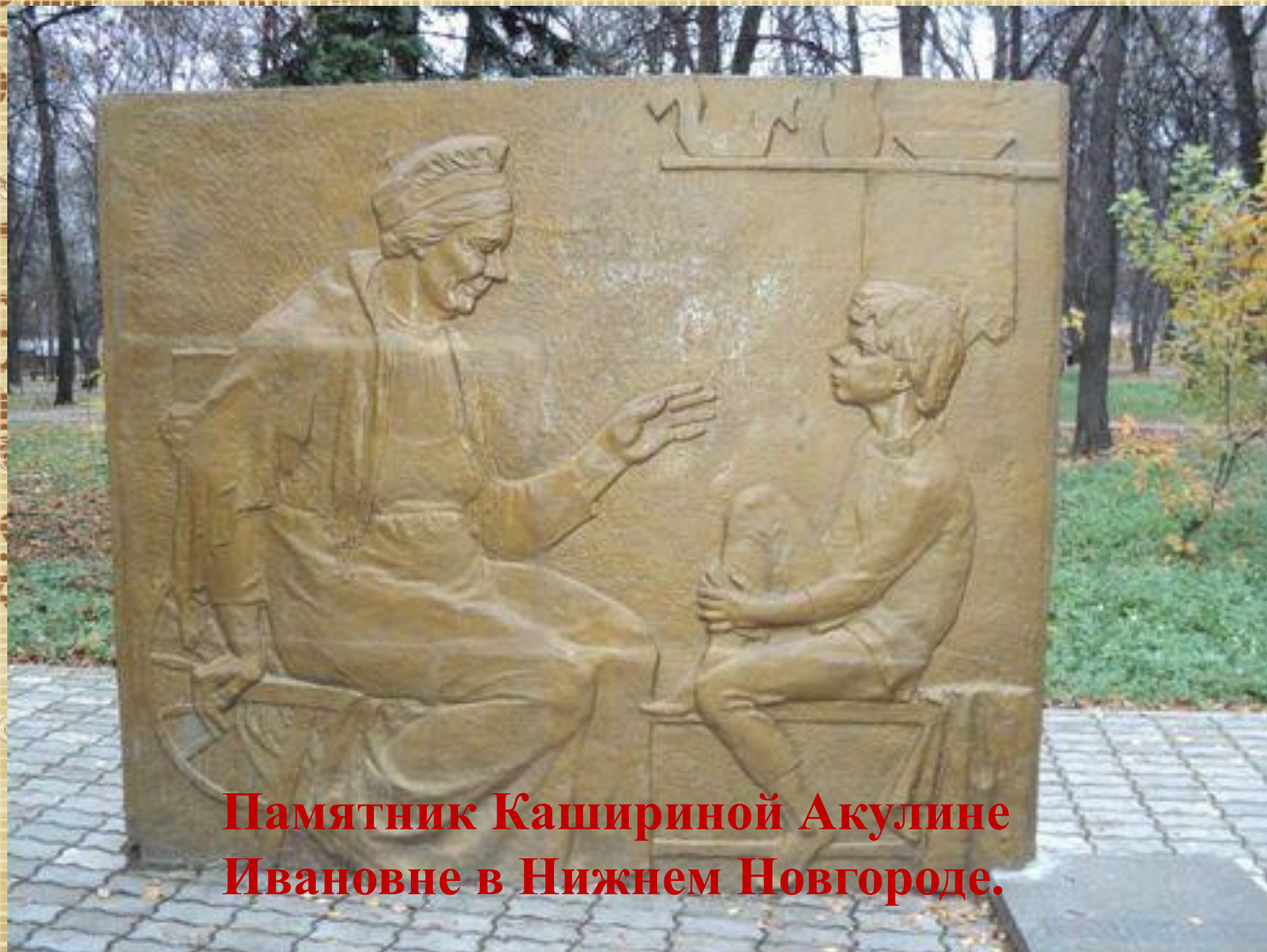
Памятник Кашириной Акулине Ивановне в Нижнем Новгороде.