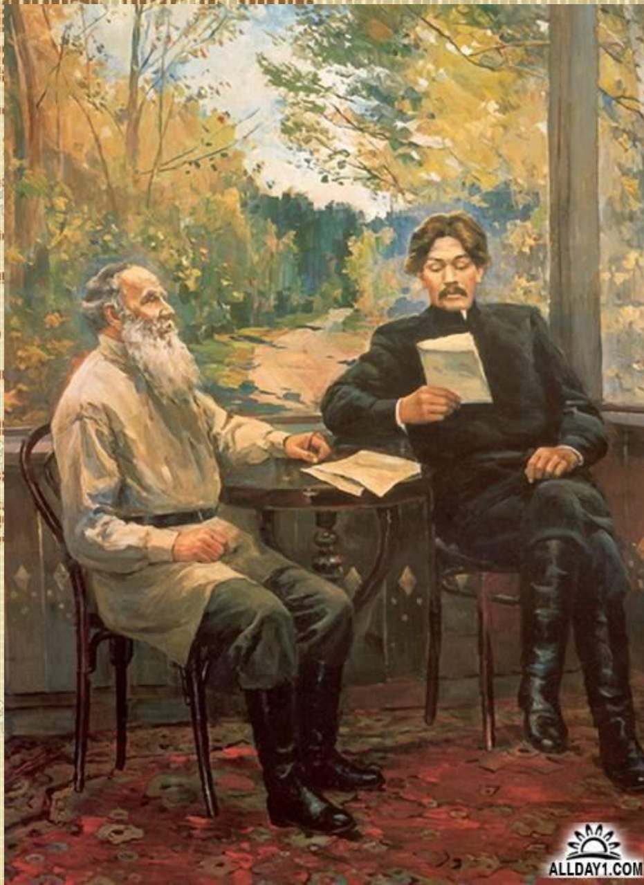
А.М.Горький и Л.Н. Толстой в Ясной поляне.