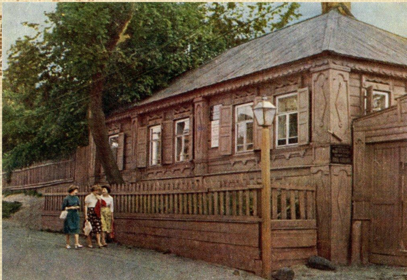
Домик Каширина, где провел детство А. М. Горький.