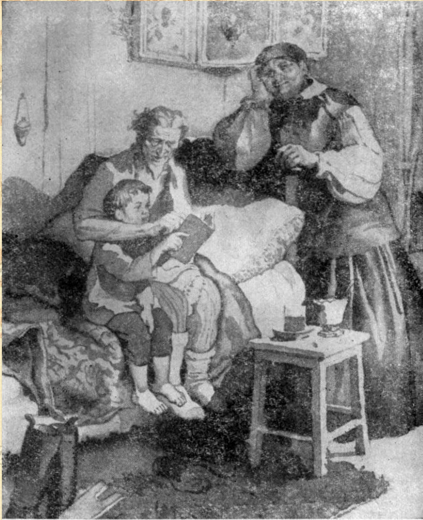
С рисунка В. А. Дехтерева.

Осиротев, Горькому приходится идти на заработки. Пробует обучаться в приходской школе, однако, заболев оспой, прекращает обучение. Позже проводит 2 года в Канавинской школе. По заявлению учителей, в школе был проблемным учеником. Во время обучения живет с матерью и отчимом, отношения с последним не складываются, после очередной сильной ссоры возвращается к деду.