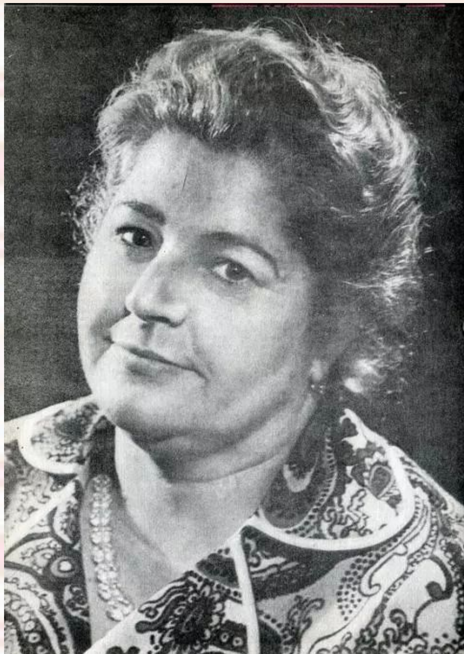
Мошковская Эмма Эфраимовна