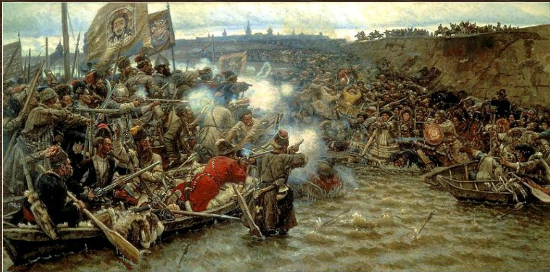
Покорение Сибири Ермаком. Художник В.И. Суриков