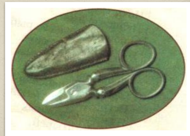
Ножницы и кожаный футляр