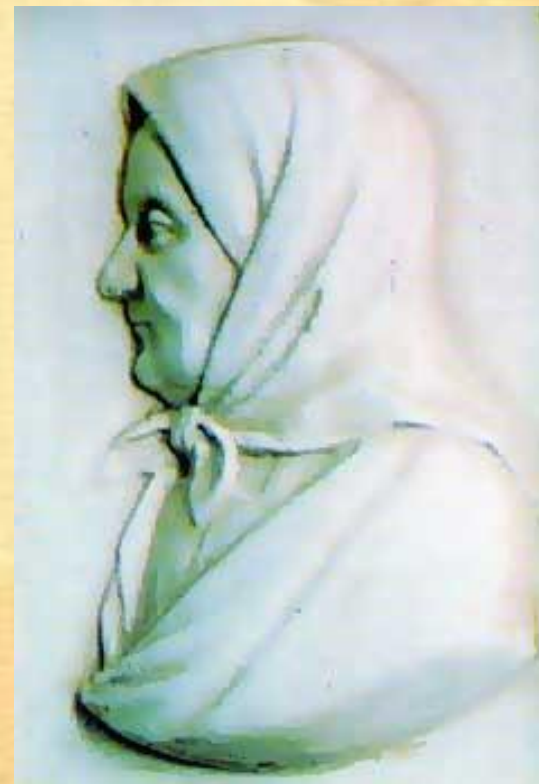
Яковлева Арина Родионовна

Любовь к родному языку маленькому Пушкину привили бабушка, Мария Алексеевна Ганнибал, превосходно говорившая и писавшая по-русски, и няня Арина Родионовна.