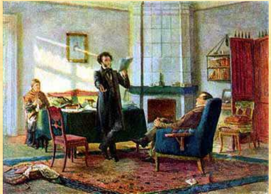
Пушкин в селе Михайловском (Пушкин у Пушкина). Н.Н. Ге. 1875 г.

За три года ссылки написаны "Кавказский пленник", "Бахчисарайский фонтан", а также "Узник", "Песнь о Вещем Олеге». Начат роман в стихах "Евгений Онегин".