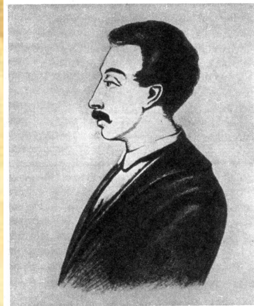
Вильгельм Карлович Кюхельбекер