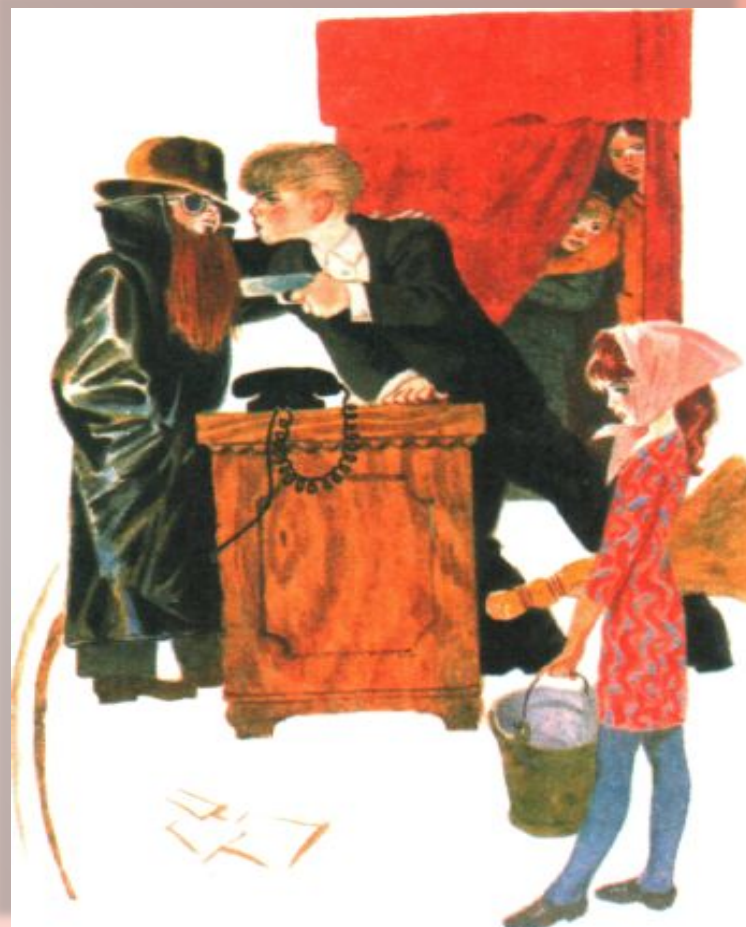
Рассказ «Где это видано, где это сдыхано»