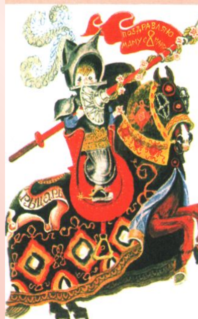
Рассказ «Кот в сапогах»