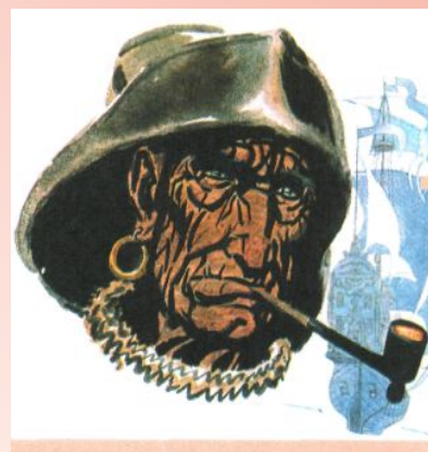
Рассказ «Старый мореход»

В 1971 году вышла книжка «На Садовой большое движение». Оформлял эту книгу художник В. Лосин. Потом именно этот сборник переводился на многие языки.