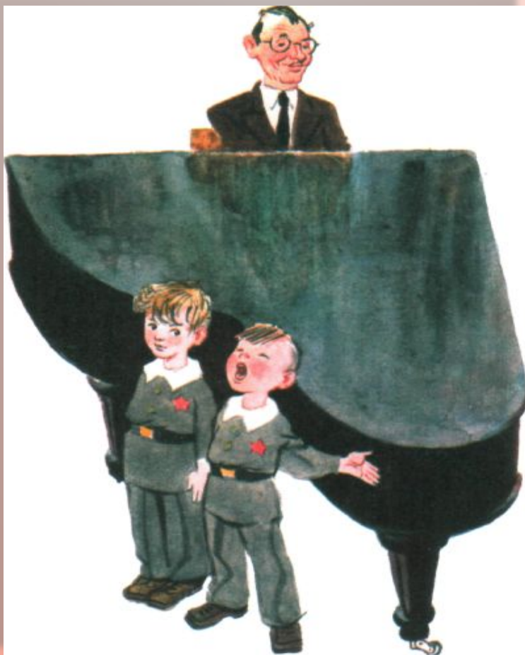
Рассказ «Смерть шпиона Гадюкина»

Недаром и его герой Дениска Кораблев в ряде рассказов участвует в театральных представлениях.