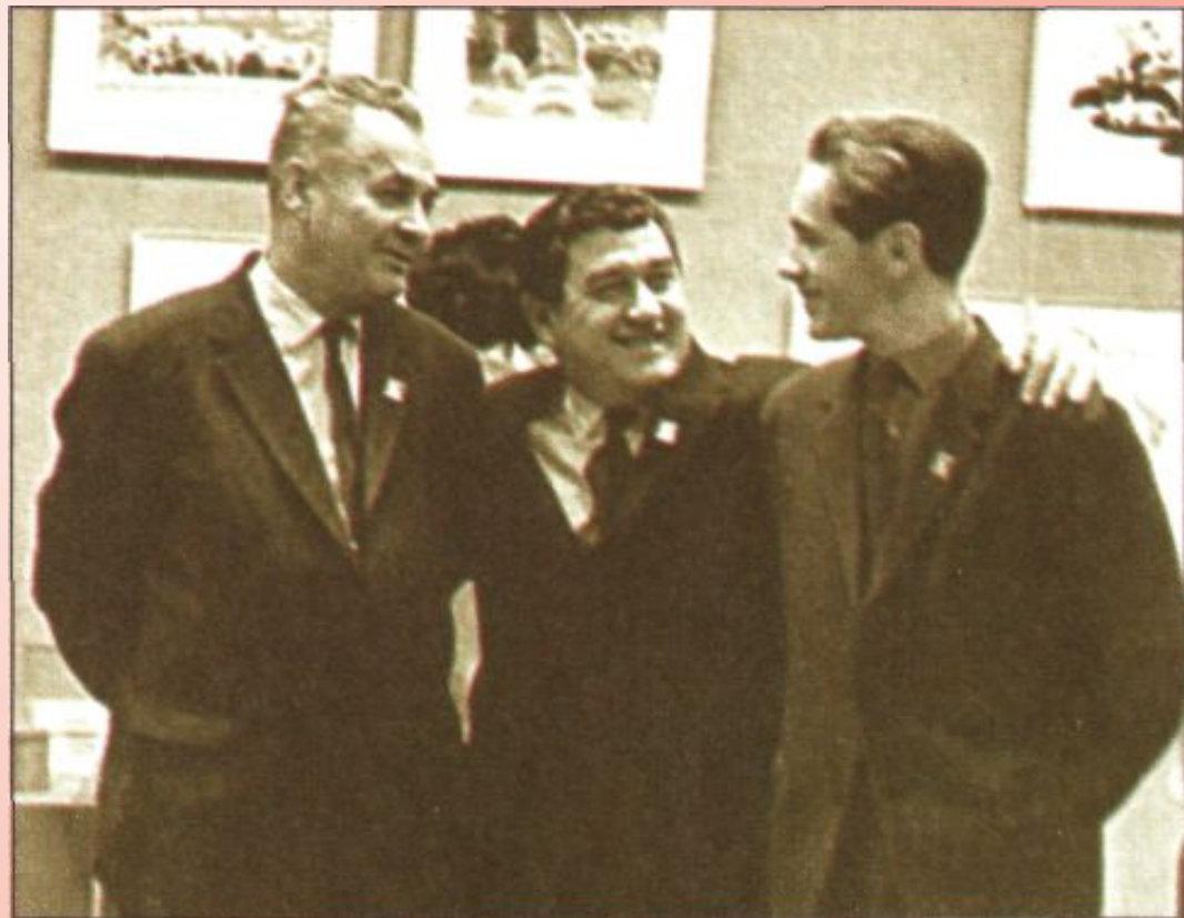
Драгунский с друзьями: художником Иваном Семеновым и поэтом Яковом Акимом

«Человек прожил так жизнь, что при упоминании этого имени – Виктор Драгунский – всякий человек, который его знал, начинает как-то улыбаться тому обстоятельству, что он был с ним близок или просто знаком...»