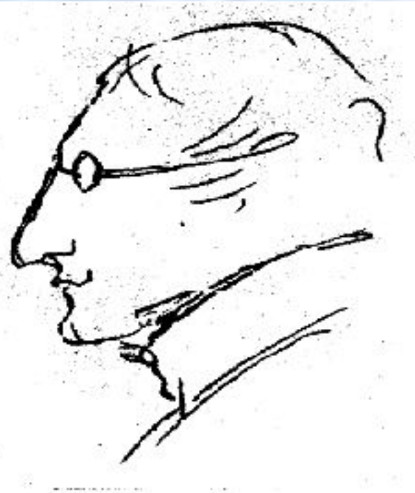
Н. В. Гоголь. Рисунок А. С. Пушкина.