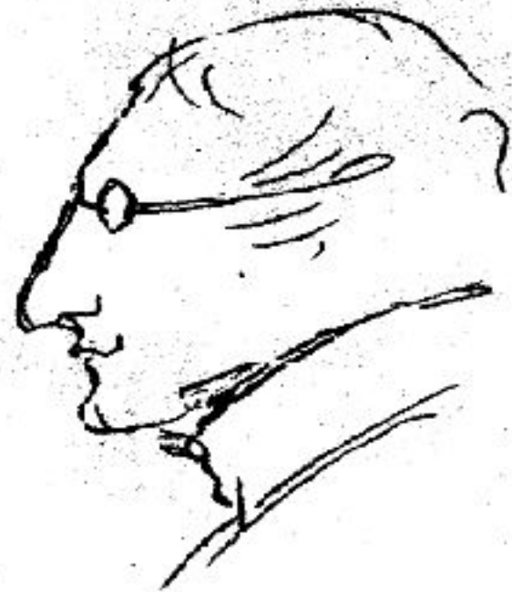
Н. В. Гоголь. Рисунок А. С. Пушкина.