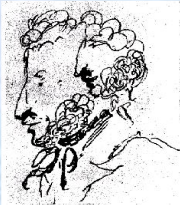
А. С. Пушкин. Рисунок Ч. В. Гесселя.

Подошел 1831г. – один из самых знаменательных в жизни Гоголя: он познакомился с Пушкиным. Ничего на свете не было для него выше и дороже Пушкина, вся его жизнь осветилась, хотелось быть лучше, чище, сделать что-то большое. Одну за другой писал он теперь свои повести: «Сорочинская ярмарка», «Майская ночь, или Утопленница», «Пропавшая грамота», «Заколдованное место». «Все, что есть у меня хорошего, всем этим я обязан ему,» - говорил Н.В.Гоголь.