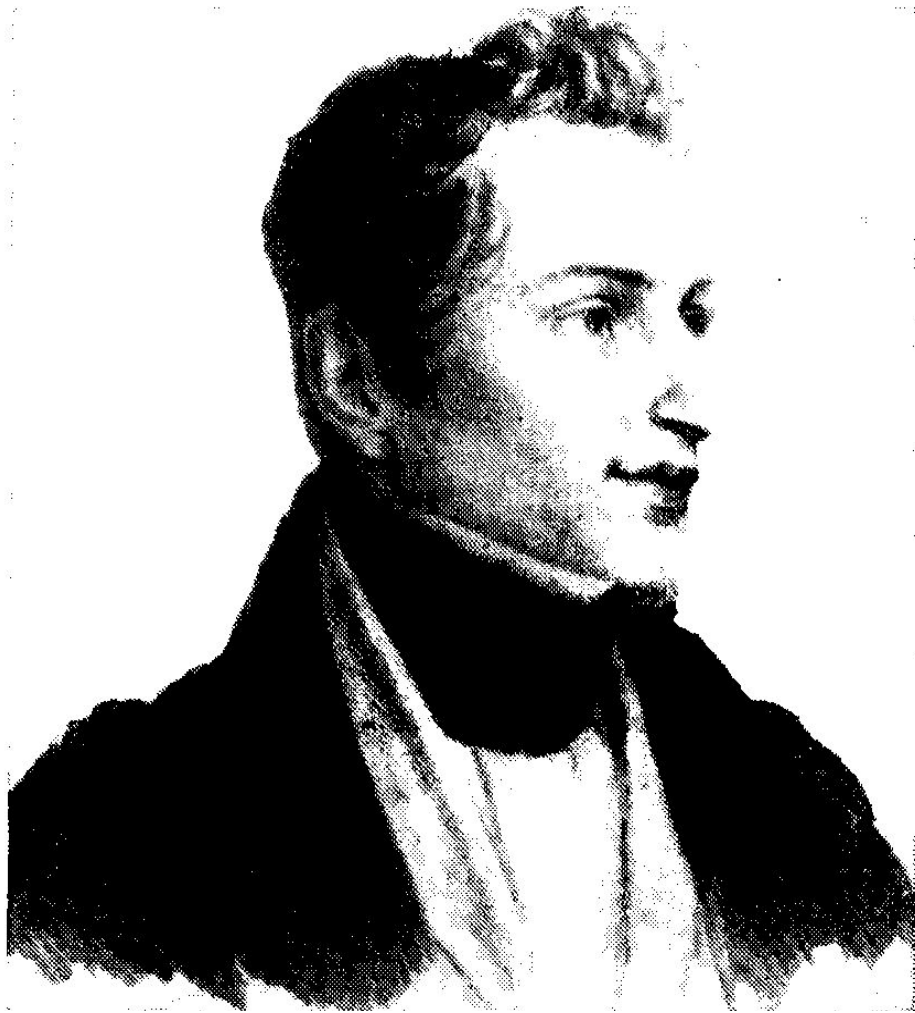
«Н. В. Гоголь». Автолитография А. Венецианова. 1834 г.

В 1828г. он закончил Нежинскую гимназию и переехал в Петербург. В 1829г. начал работать над повестями из украинской народной жизни, составившими впоследствии книгу «Вечера на хуторе близ Диканьки».