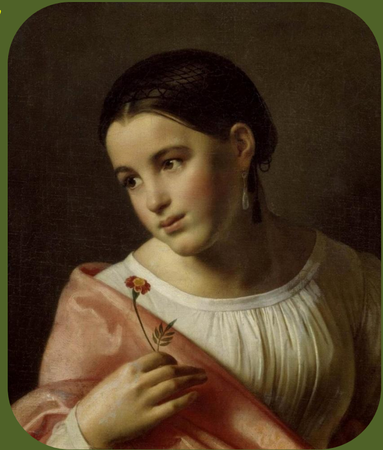
О.Кипренский. Бедная Лиза