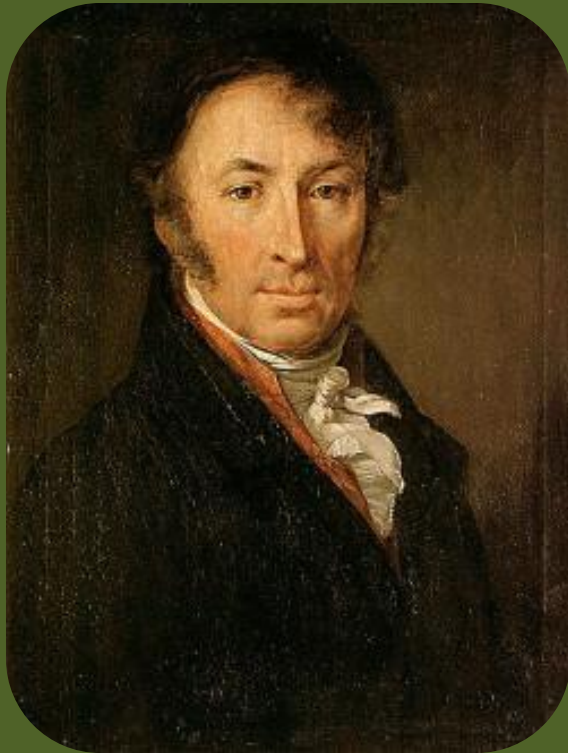
Портрет Н.М. Карамзина. В. Тропинин