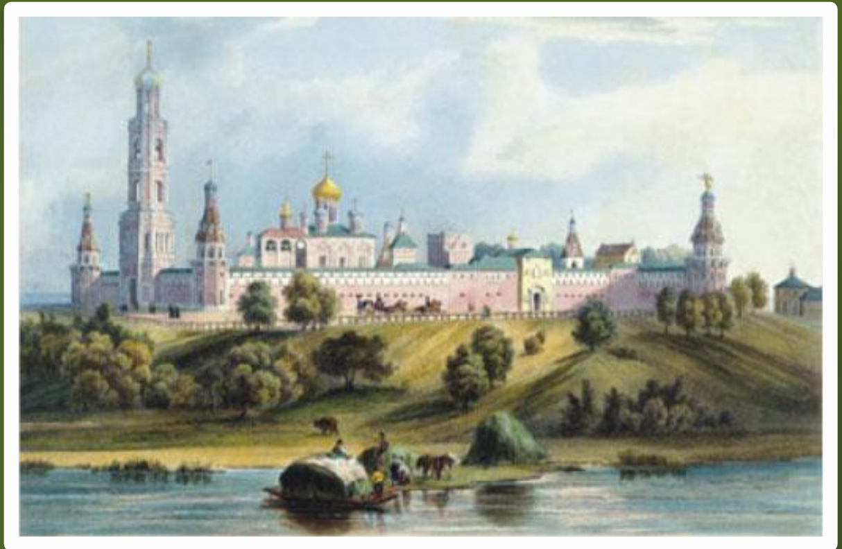
Симонов монастырь в Москве. Бишбуа «Виды Москвы»