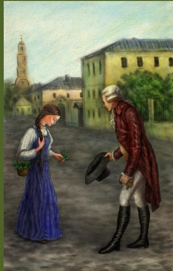
Встреча Эраста с Лизой Компьютерная графика