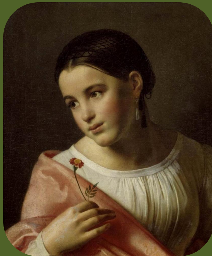
О.Кипренский. Бедная Лиза