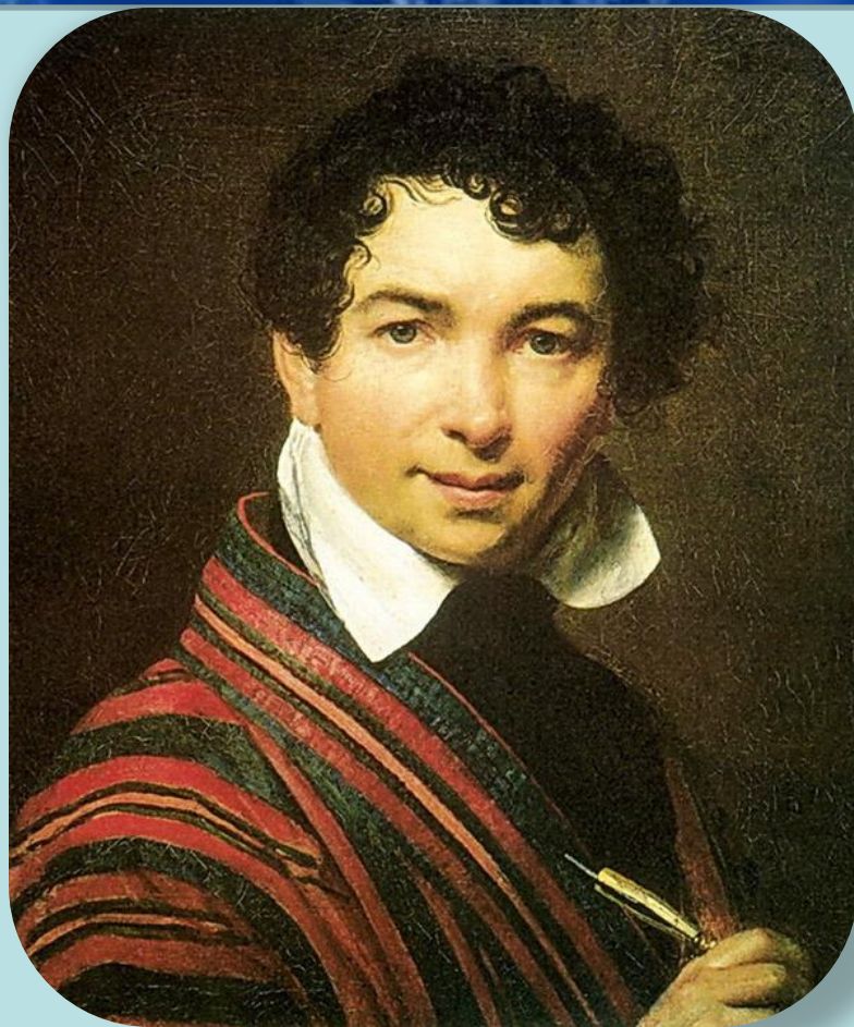
Орест Адамович Кипренский 1782-1836