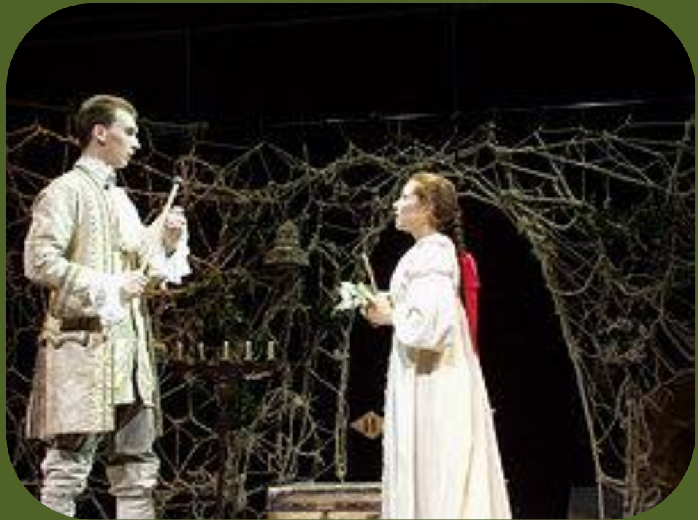
Эраст и Лиза. Мюзикл