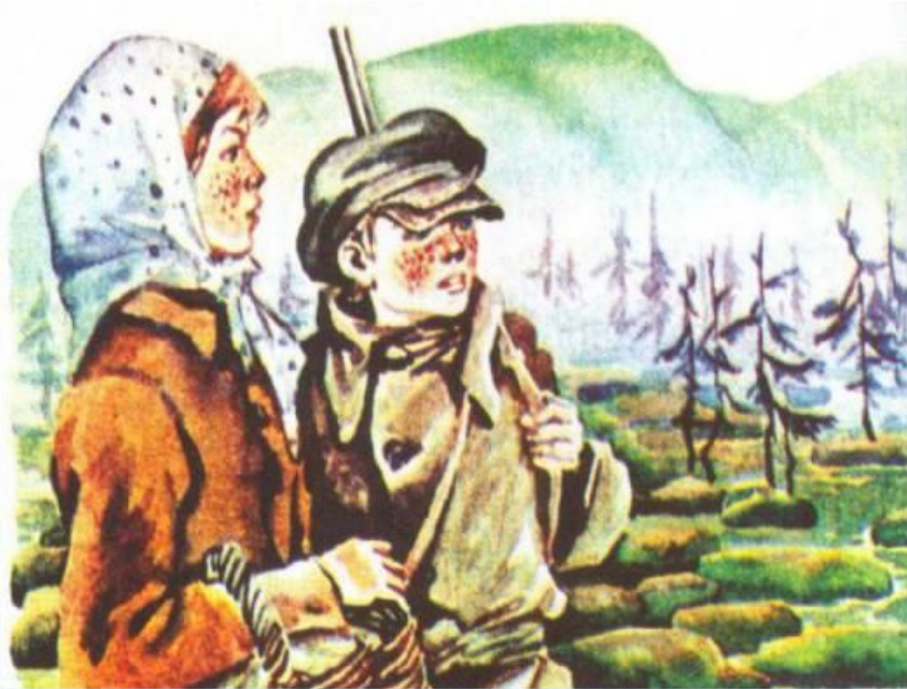
П.В.Калинин. Митраша и Настя

Однажды весной собрались ребята в лес за клюквой на болото, в это время ягода бывает сладкая. Как только сошел снег ее видимо не видно на полянках, которые называют кладовые солнца.