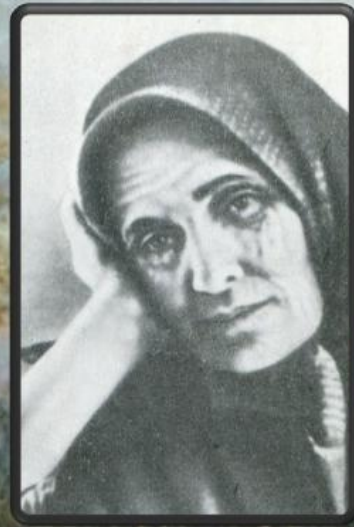
Бабушка Сергея Есенина.