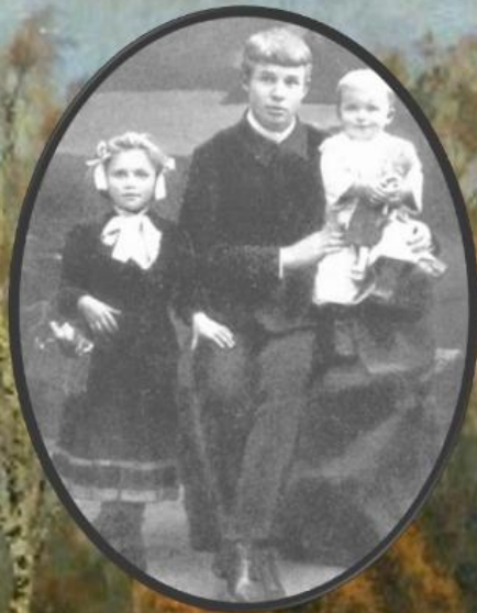
Сергей Есенин и его сёстры.