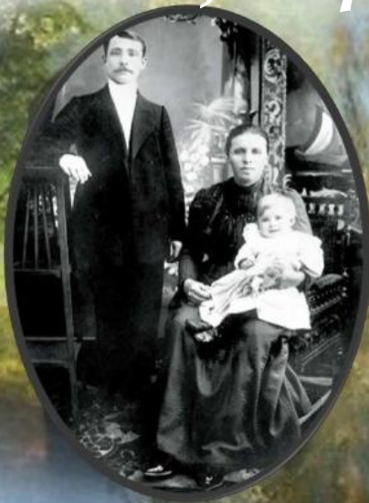
Родители Сергея Есенина.