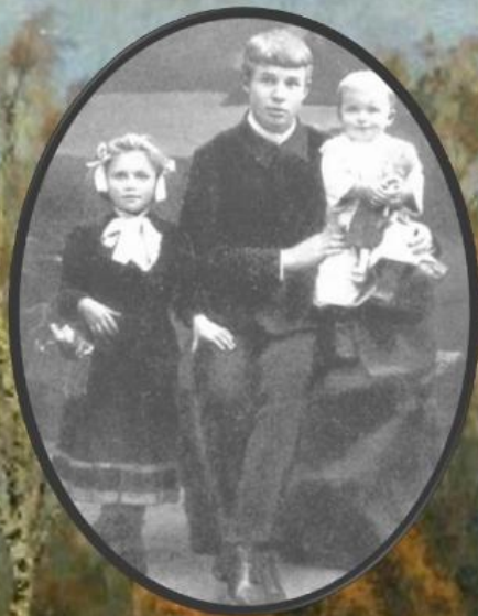
Сергей Есенин и его сёстры.