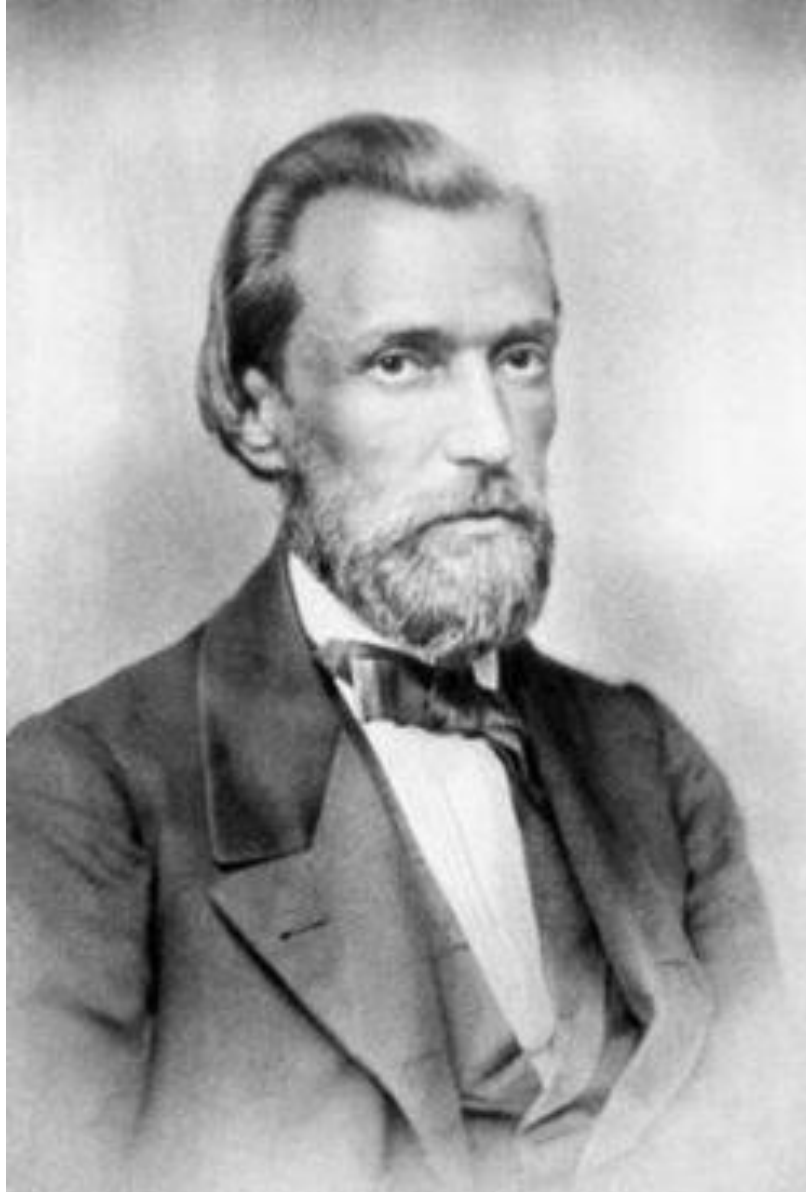
Иван Саввич НИКИТИН (1824 -1861)