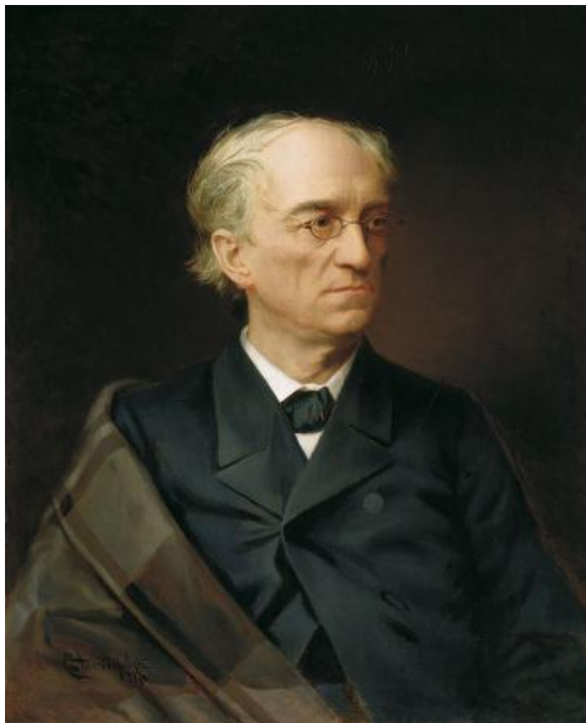
Федор Иванович Тютчев (1803-1873)