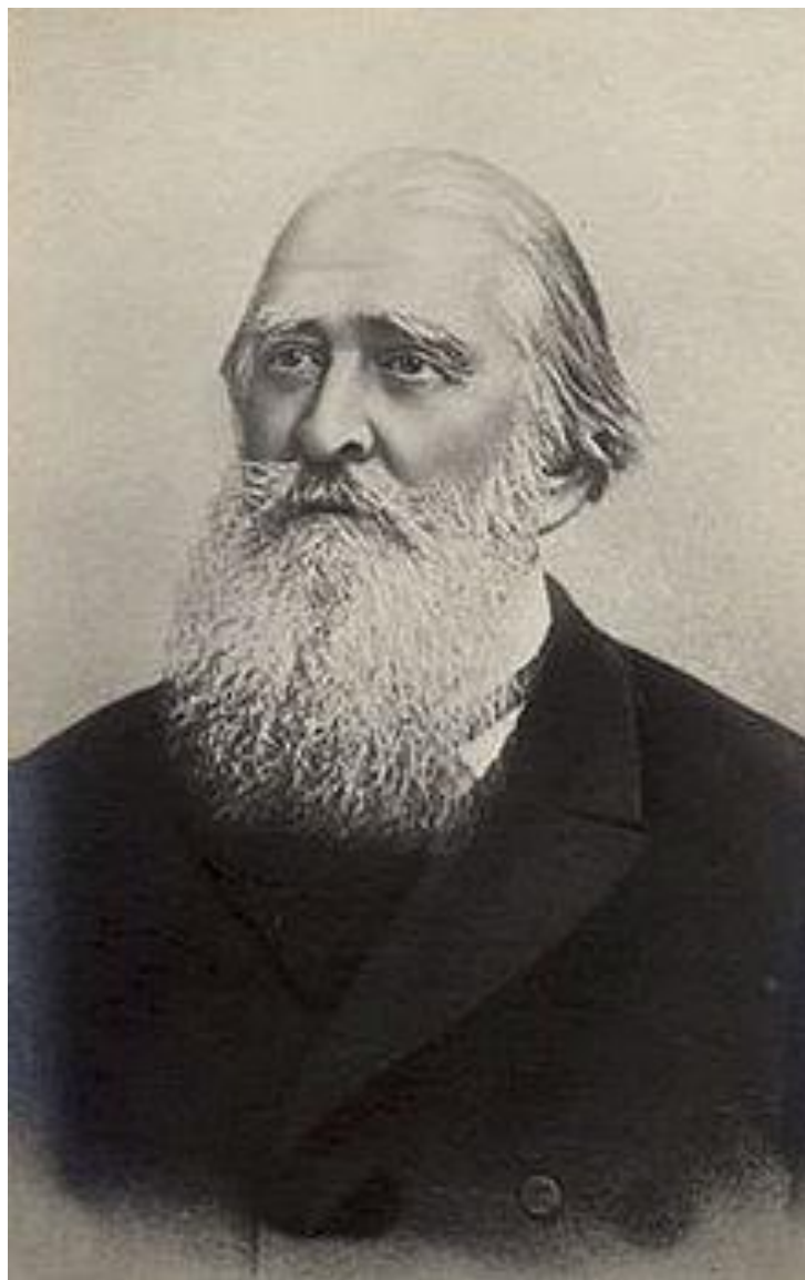
Алексей Николаевич Плещеев (1825-1893)