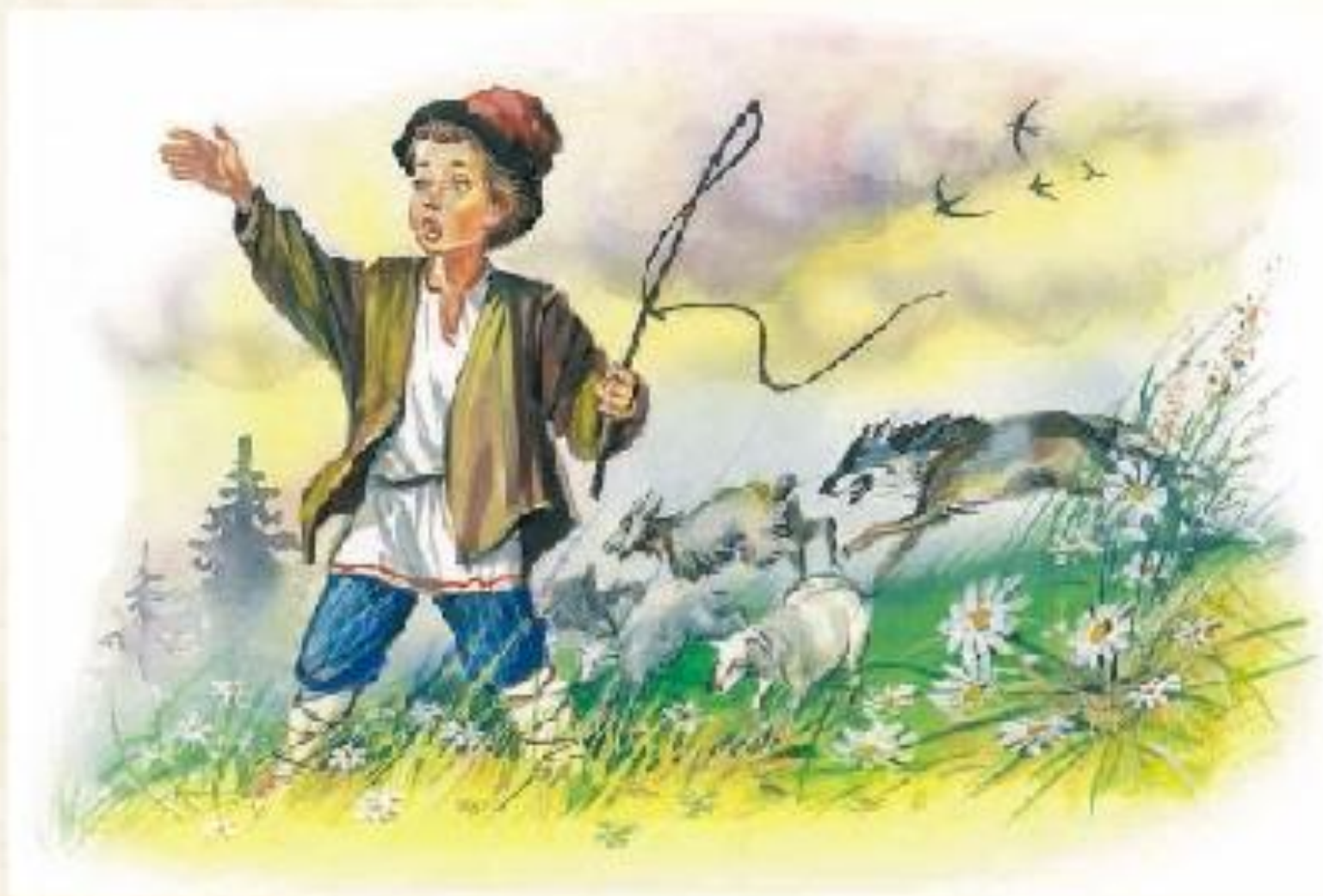
Л. Н. Толстой «Лгун»