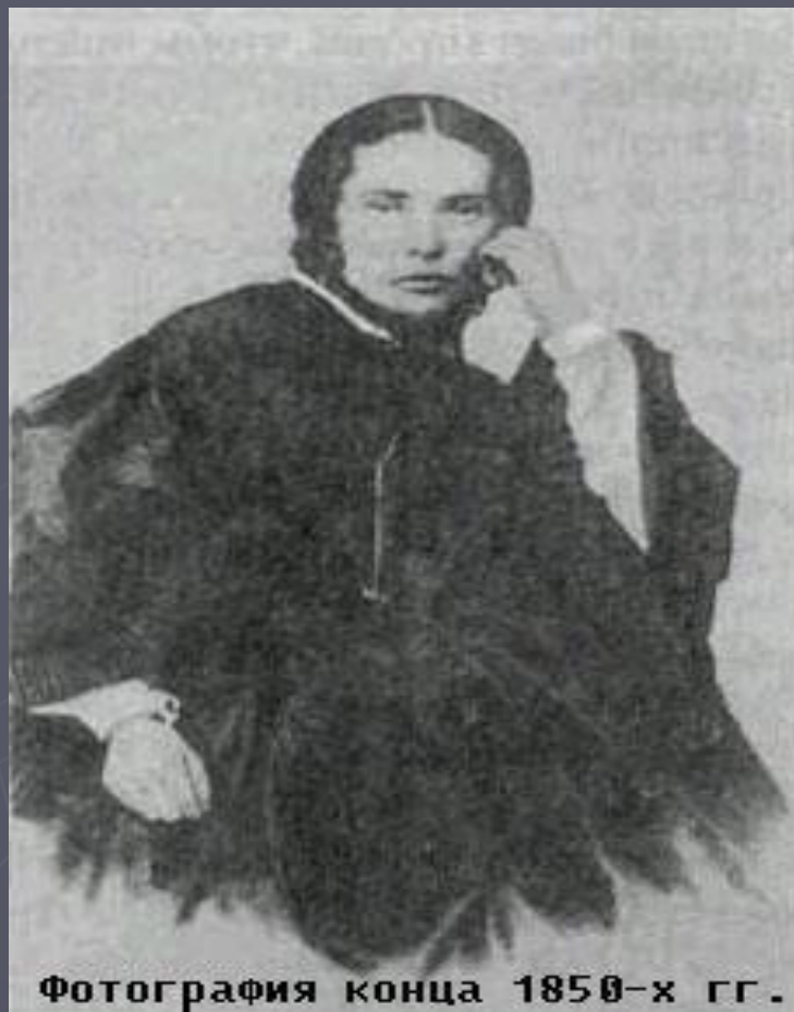
Фотография конца 1850-х гг.

В начале 1857 года Достоевский женится. Его женой становится вдова отставного чиновника Мария Дмитриевна Исаева . Он влюбился в неё с первого взгляда, но у Марии Дмитриевны был не ангельский характер, и поэтому брак был неудачным.