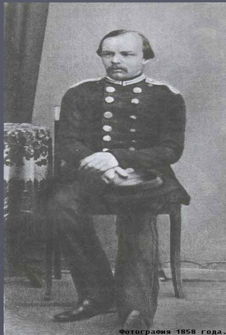
Фотография 1858 года.

20 октября 1856 года Достоевский был произведён в прапорщики .