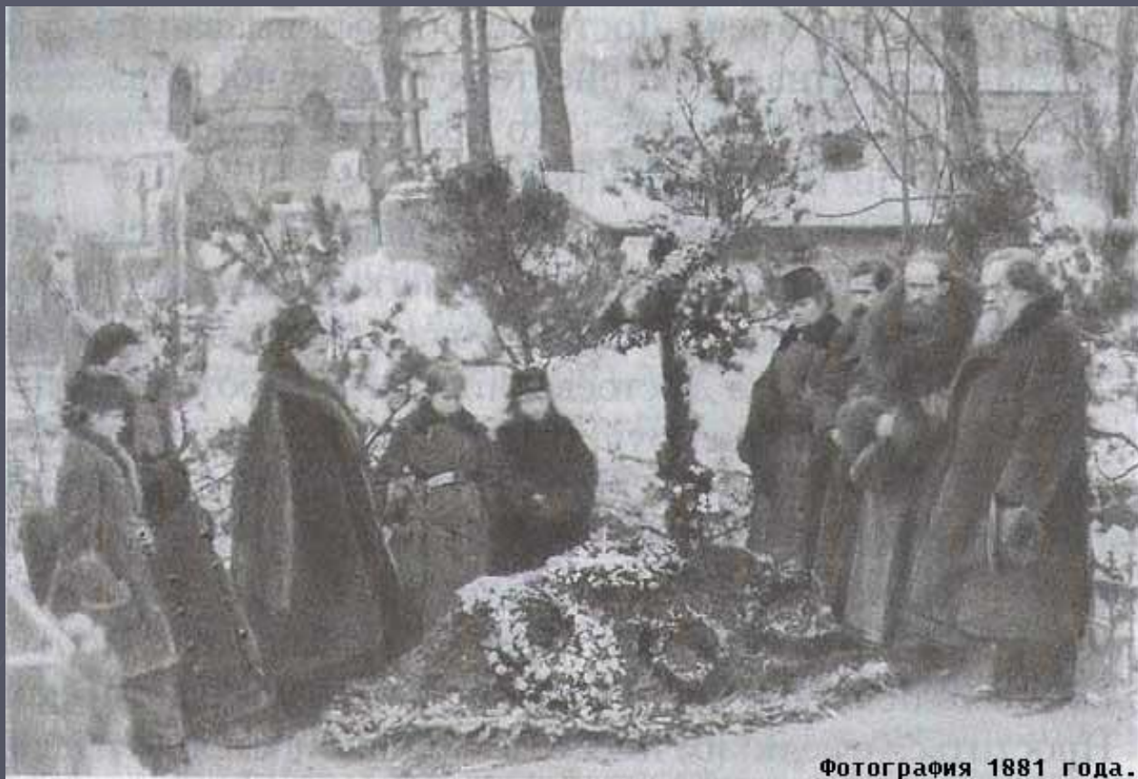
Фотография 1881 года.

Писатель похоронен в Алекса́ндро-Невской лавре в Санкт-Петербу́рге.