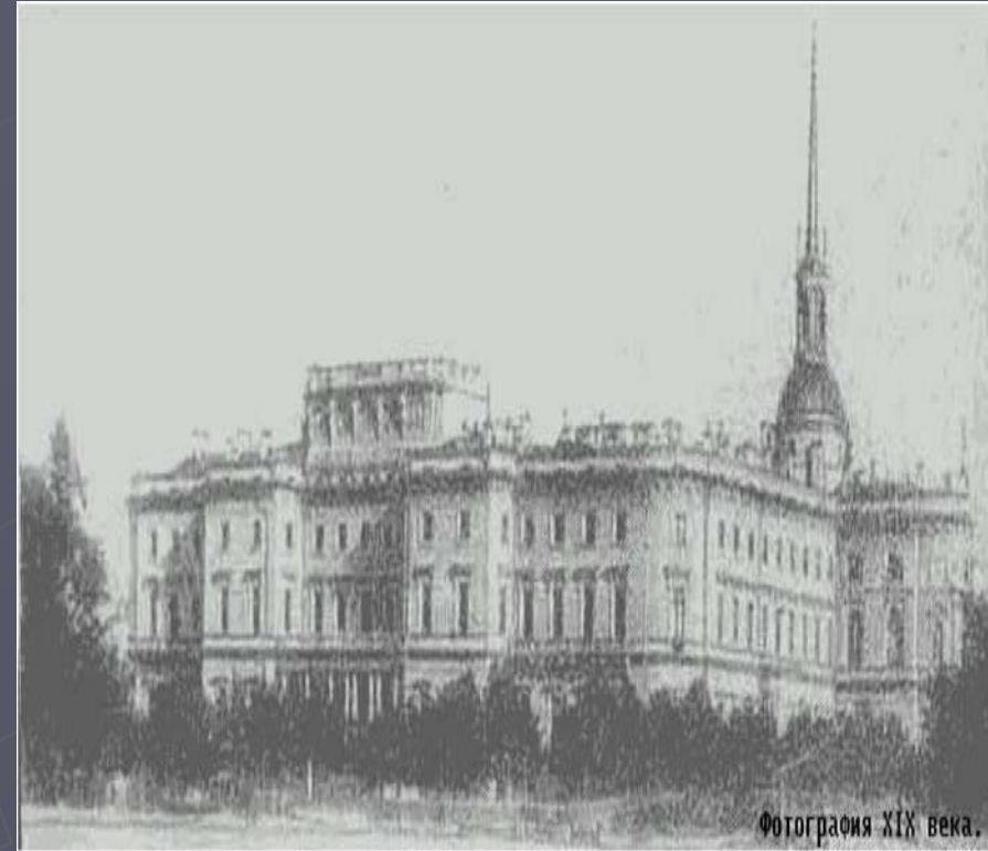
Фотография XIX века.

1838 год – Достоевский поступил в Главное инженерное училище (Военный инженерно-технический университет) в Санкт-Петербурге.