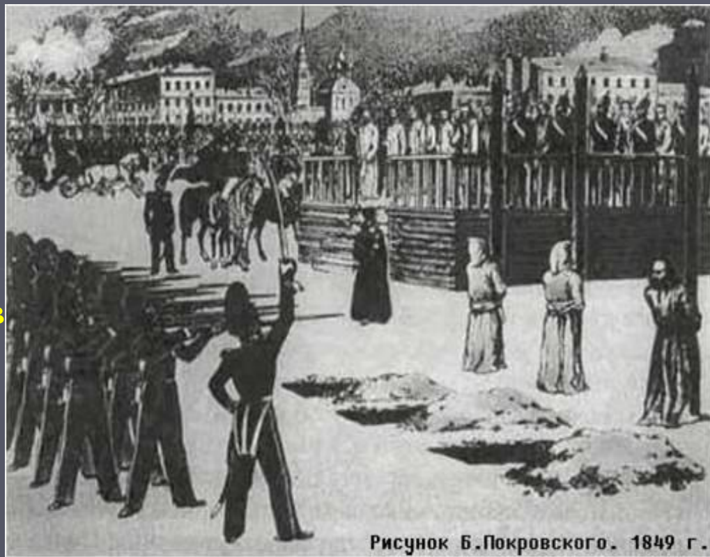
Рисунок Б.Покровского. 1849 г.

22 декабря 1849 Достоевский вместе с другими ожидал на Семёновском плацу исполнения смертного приговора. По резолюции Николая I казнь была заменена ему 4-летней каторгой с лишением "всех прав состояния" и последующей сдачей в солдаты