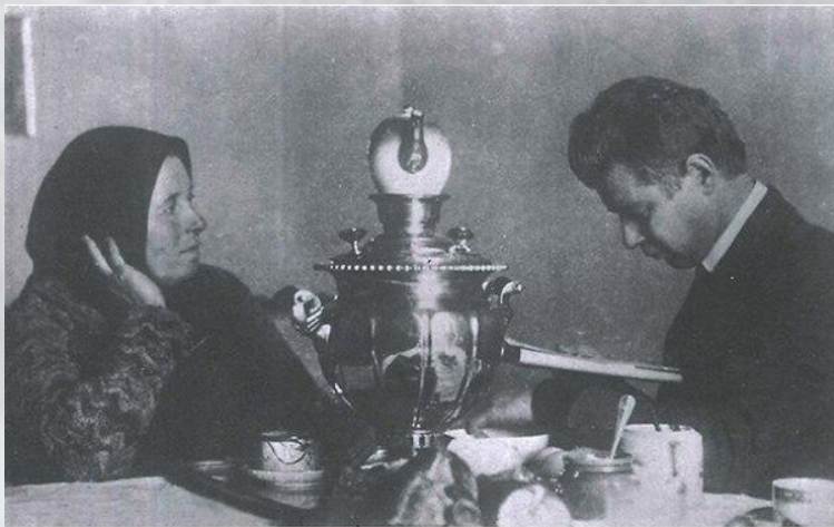
Есенин с матерью. Москва, март 1925 года