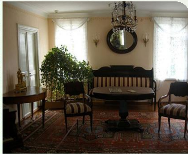
Гостиная дома Верзилиных в Пятигорске

Большую часть творческого наследия писателя мы видим именно здесь. Сюда входят: зарисовки и картины Лермонтова, книги, исторически ценные документы, журналы, документальные материалы того времени и другие не мало важные вещи. Находясь в литературном музее, можно убедиться в том, насколько сильно Кавказ вплетался в жизнь и творческую деятельность писателя.