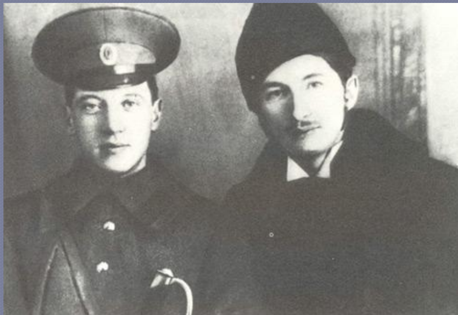
Николай Гумилев и Сергей Городецкий. 1915 г.

В 1911 году Гумилев, совместно с Сергеем Городецким, создает новую литературную группу - «Цех поэтов». В феврале 1912 г. в редакции «Аполлона» Гумилев заявил о рождении нового литературного течения, которому присвоили имя «акмеизм».