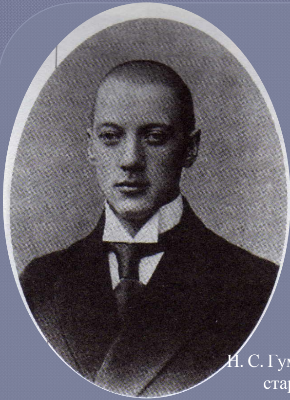
Н. С. Гумилев – гимназист старших классов

Сын военного врача, Н.С.Гумилев окончил Царскосельскую гимназию, директором и преподавателем которой был известный поэт И.Ф. Анненский, воспитавший в своем ученике любовь к литературе.