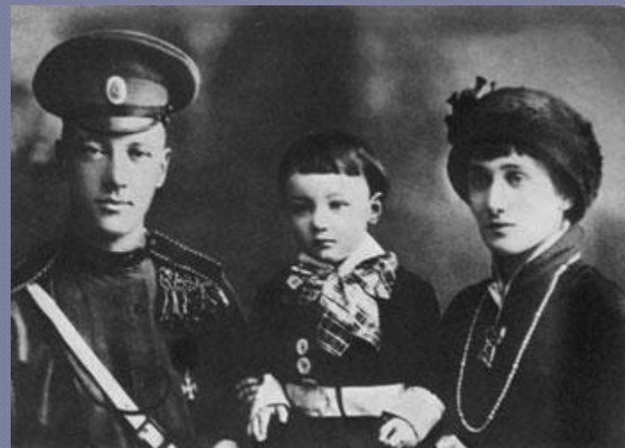
А.Ахматова и Н.Гумилев с сыном Львом.