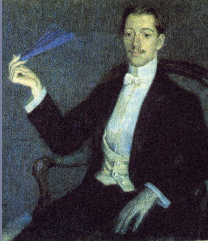
М. В. Фармаковский. Портрет Н.С. Гумилева. 1908г.

Поэзия «серебряного века» немыслима без имени Николая Степановича Гумилева (1886-1921). Создатель литературного течения акмеизм, он завоевал интерес читателей не только талантом, оригинальностью стихов, но и необычной судьбой, страстной любовью к путешествиям, которые стали частью его судьбы.