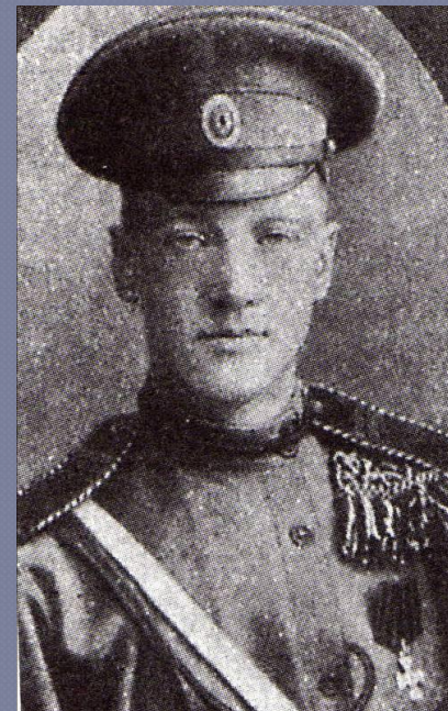
Н. С. Гумилев. Фотография. 1914г.

Молодой поэт твердо поставил перед собой цель – стать героем, смельчаком, выбирающим трудные и опасные пути, бросающим вызов всему миру. От природы робкий, физически слабый, он приказал себе стать сильным и решительным.