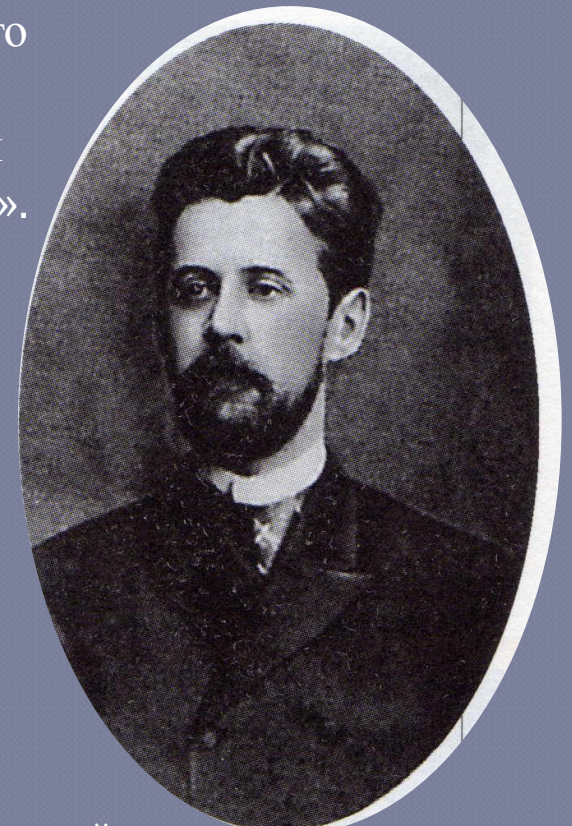
И.Ф. Анненский – директор и преподаватель Царскосельской гимназии

Современники описывали «белобрысого самоуверенного юношу, внешне крайне неблагообразного, с косящим взглядом и шепелявой речью».