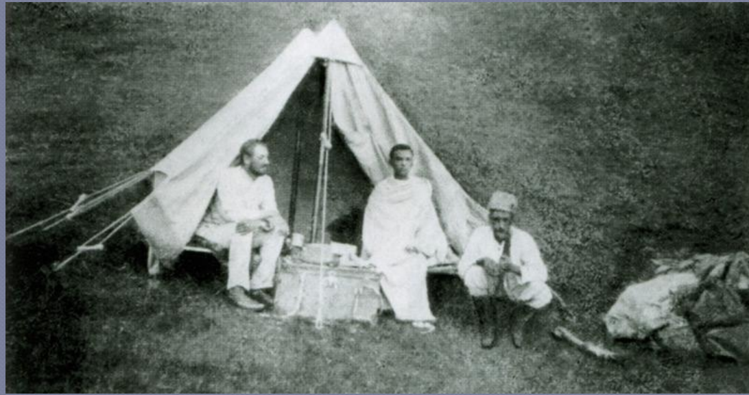
Гумилев в экспедиции в Африке.