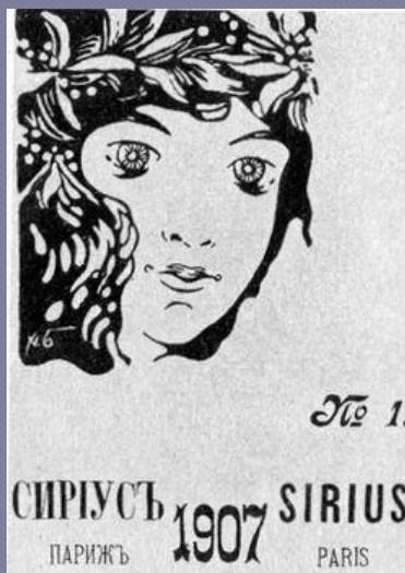
Обложка журнала «Сириус», 1907 г., №3

В свой первый приезд в Париж Гумилев посылал стихи в Москву в журнал «Вехи» .