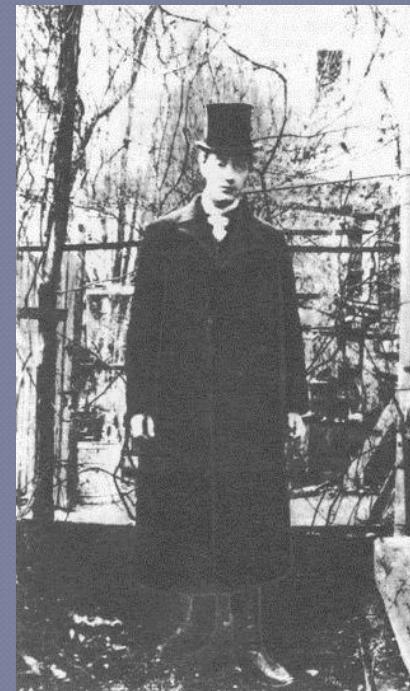
Н.Гумилев в Париже. 1908г.

Сборник, изданный в Париже в 1908 году, Гумилев назвал «Романтические цветы» .