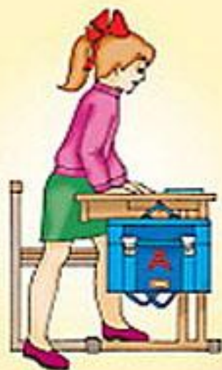
Посадка за парту