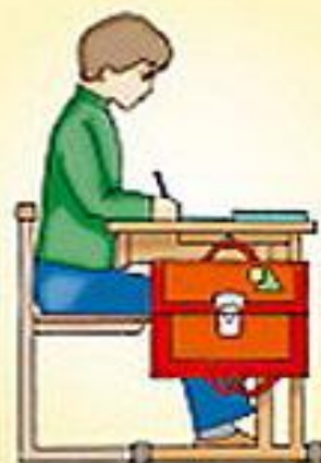
Посадка при письме