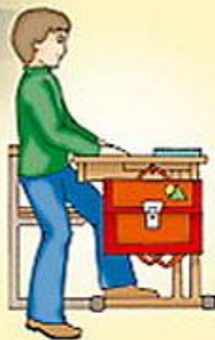
Выход из-за парты