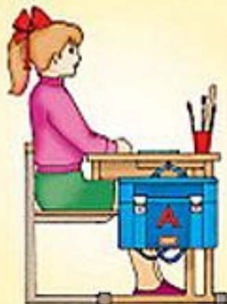
Посадка "готов к работе"