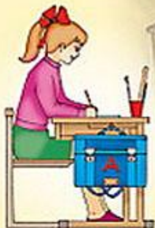
Посадка при чтении и ручных работах