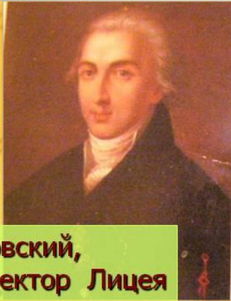
В.Ф. Малиновский, первый директор Лицея