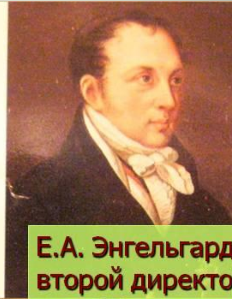
Е.А. Энгельгардт, второй директор Лицея