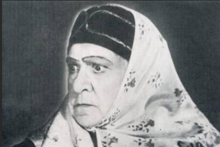
Кабаниха (В.Н. Пашенная)

Про нее говорят, что она — ханжа, “нищих оделяет, а домашних заела совсем”. Кабаниха постоянно упрекает всех вокруг за то, что они не проявляют к ней должной почтительности и уважения. Впрочем, и уважать ее совершенно не за что. Кабанова настолько донимает своих домочадцев, что они тихо ненавидят ее. Иначе к ней относиться просто нельзя.