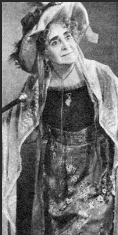
Полусумасшедшая барыня Гроза А.Островского 1962